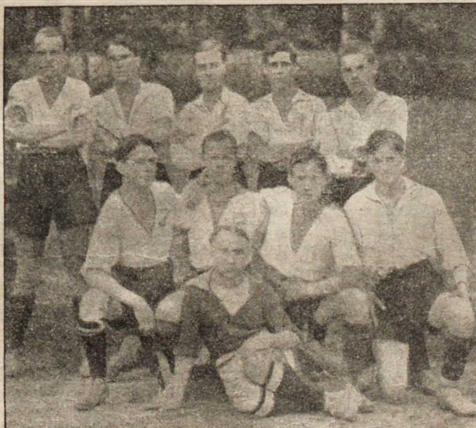
Команда М. К. Л. С., выигравшая первенство Петровско-Разумовской футбольной лиги на 1917 г.