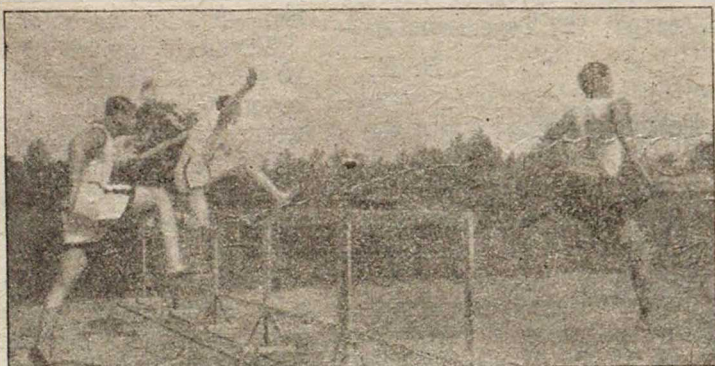
Барьерный бѣгъ на «Первенство Петрограда». Финаль: Литовченко, Рѣшетниковъ, Гантваргъ.

Прыжки съ шестомъ. 1) О. Сяркя («Унитасъ»)—2 метр. 90 сант.; 2) С. Седергольмъ («Унитасъ»)—2 метр. 90 сант. (съ 6-й попытки) и 3) А. Румба—2 метр. 80 сант.