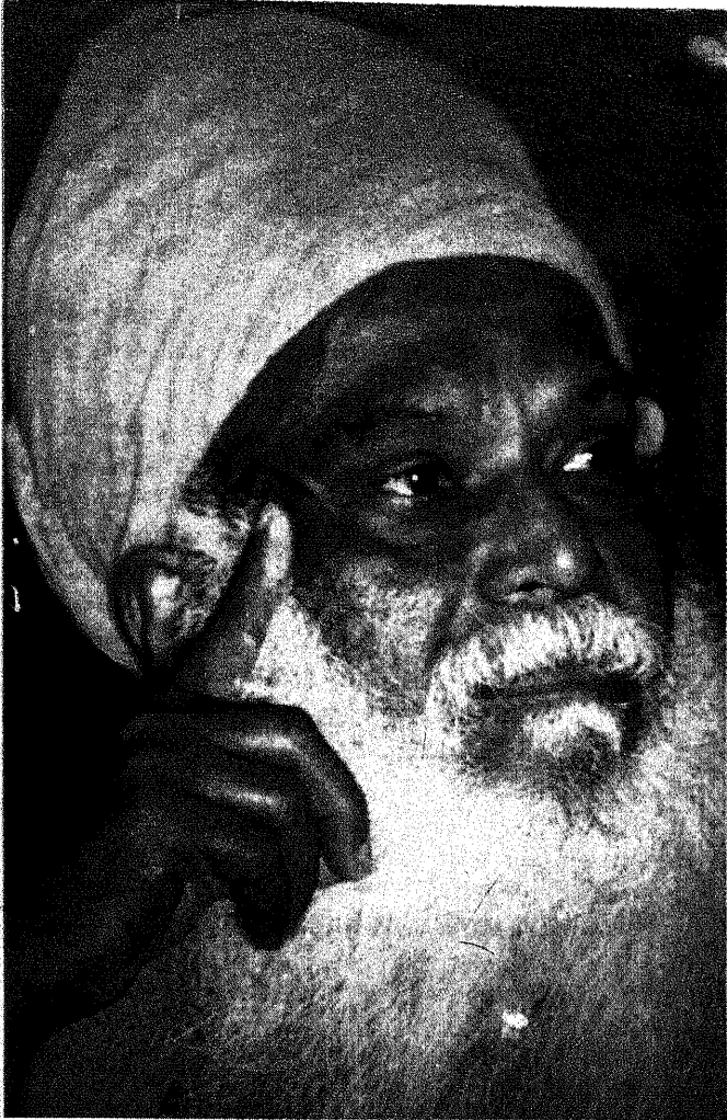
தமிழ் மாமுனிவர் தவத்திரு குன்றக்குடி அடிகளார் 1925 - 1995