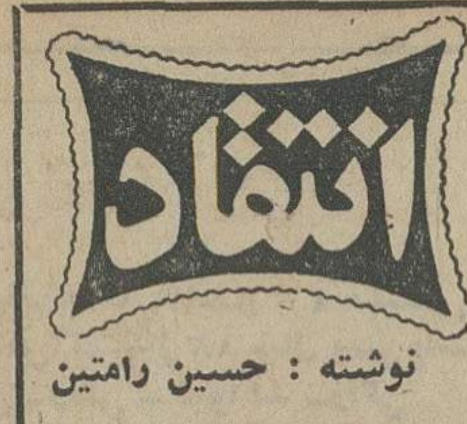
نوشته: حسین نامینی