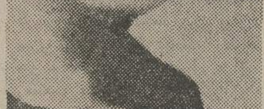
خانه ورژیک ساقی زیباروی مهمانسرای شاه عباس را به آتش کشیدند . او درین آتش‌سوزی جان سپرد.

پرونده قتل ساقی زیباروی بار سال‌هاست در اسفهان ، بدلیل نقص تحقیقاتی به دادرسی شهرستان اصفهان باز گردانده شد.