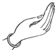
Ster en maan