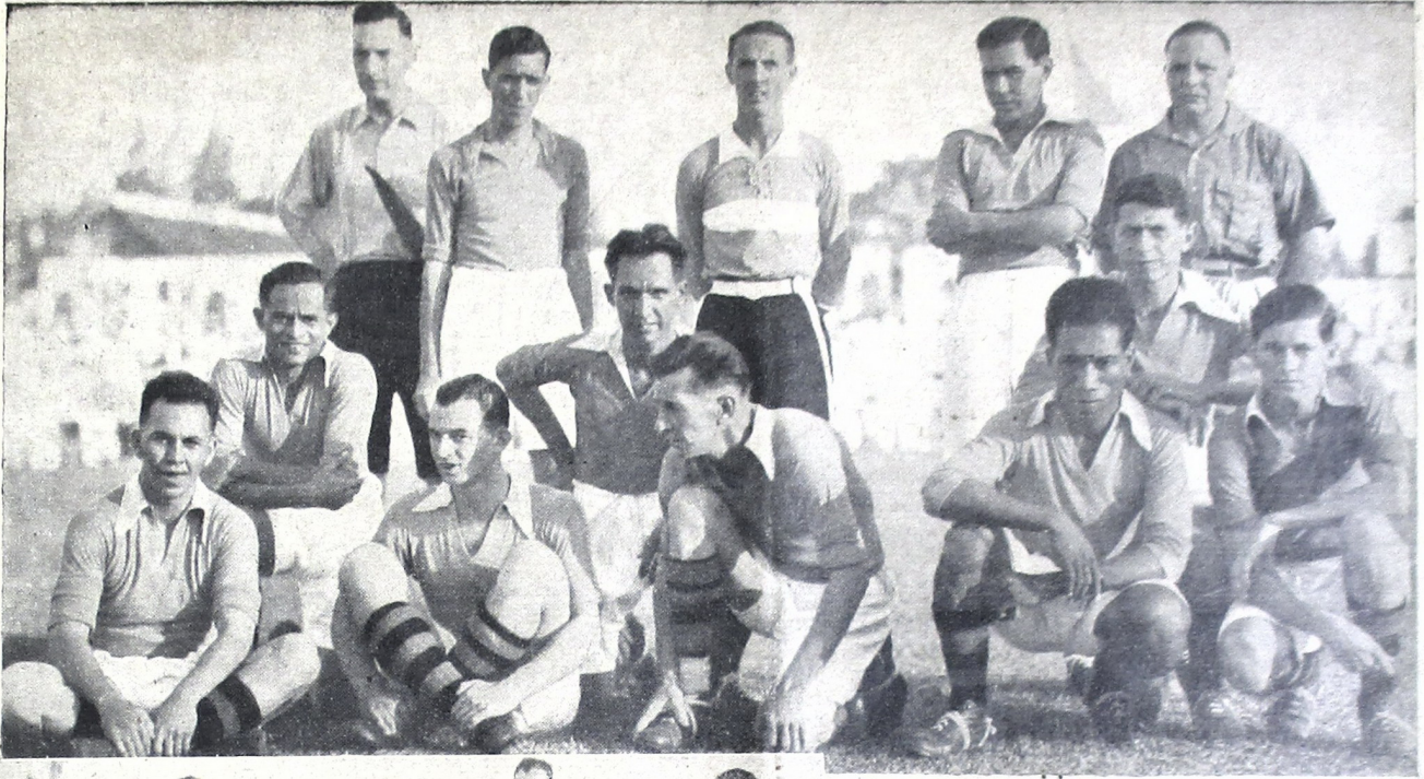
Kampioen bal-balan bangsa Eropa saking Soerabaja, ingkang oenggoel tanjing kalijan Bandoeng.