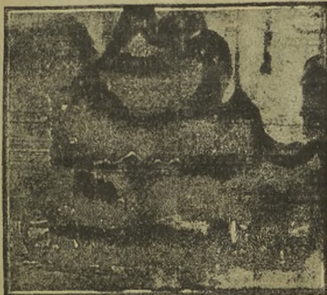
Propiedad de la Empresa de Pompas Fúnebres