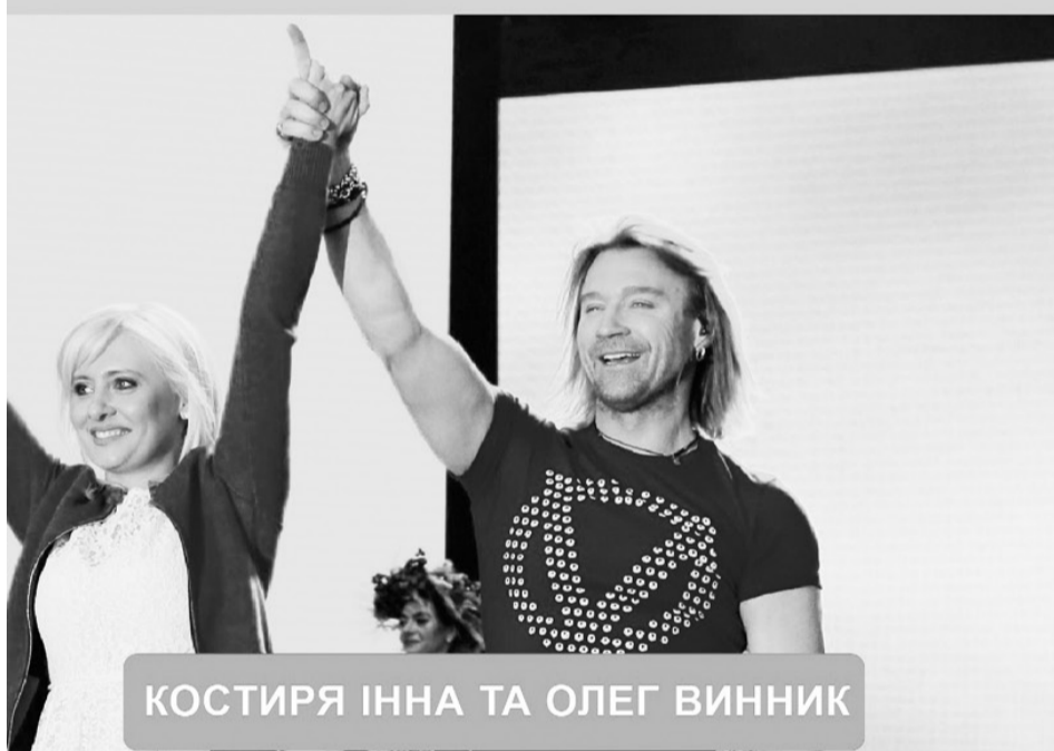
КОСТИРЯ ІННА ТА ОЛЕГ ВИННИК