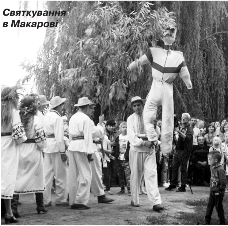
Святкування в Макаріві

Найколіоритніше та найцікавіше свято, яким закінчується літній сонячний цикл календарних дохристиянських свят – це свято молоді – Купало або Купайло. У наймагічнішу ніч з 6 на 7 липня у різних куточках району відбулися народні гуляння – відзначали свято Івана Купала. Головними персонажами його були «Купало» та «Марена», які уособлюють чоловіче (сонячне) і жіноче (водяне) божества.