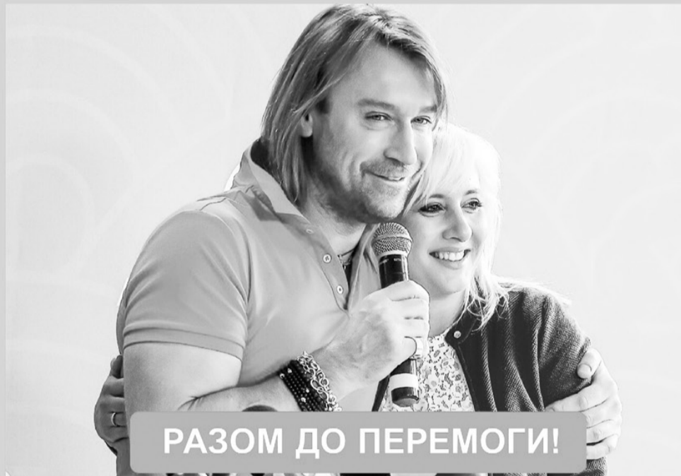
РАЗОМ ДО ПЕРЕМОГИ!