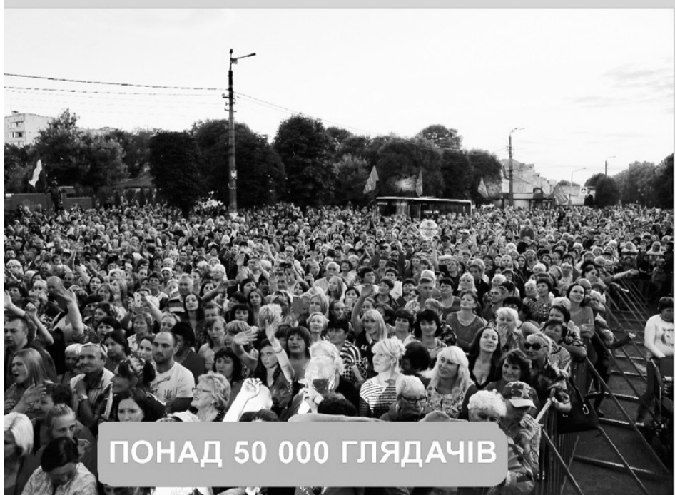
ПОНАД 50 000 ГЛЯДАЧІВ