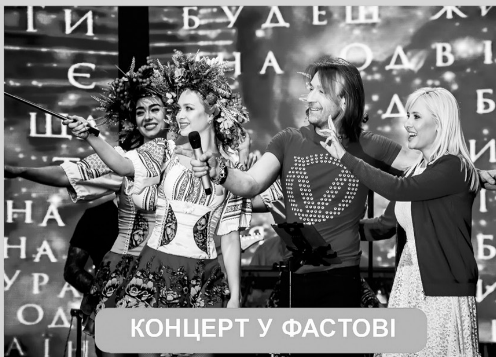
КОНЦЕРТ У ФАСТОВІ