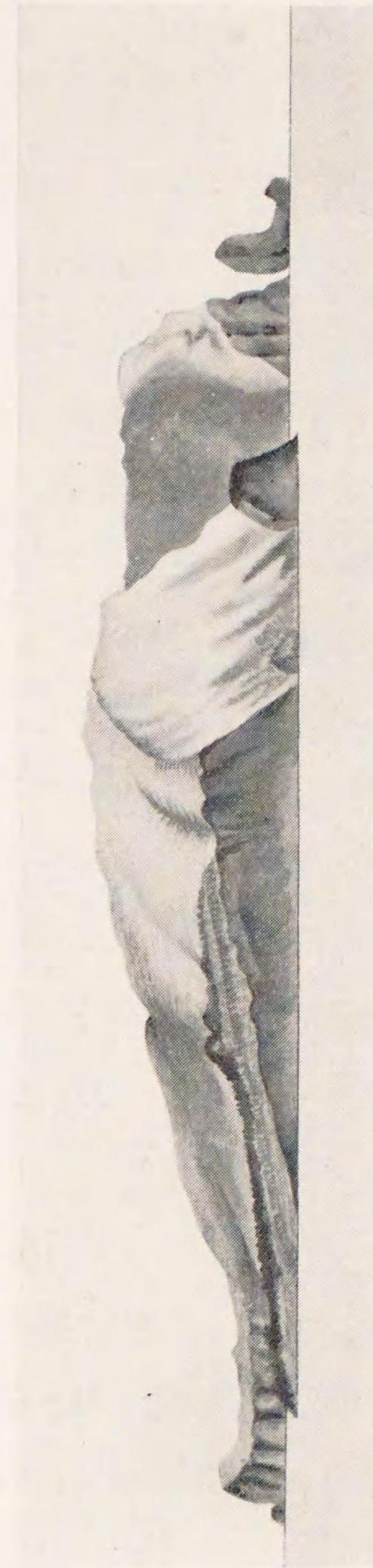
Ninepin Rk. 297 度