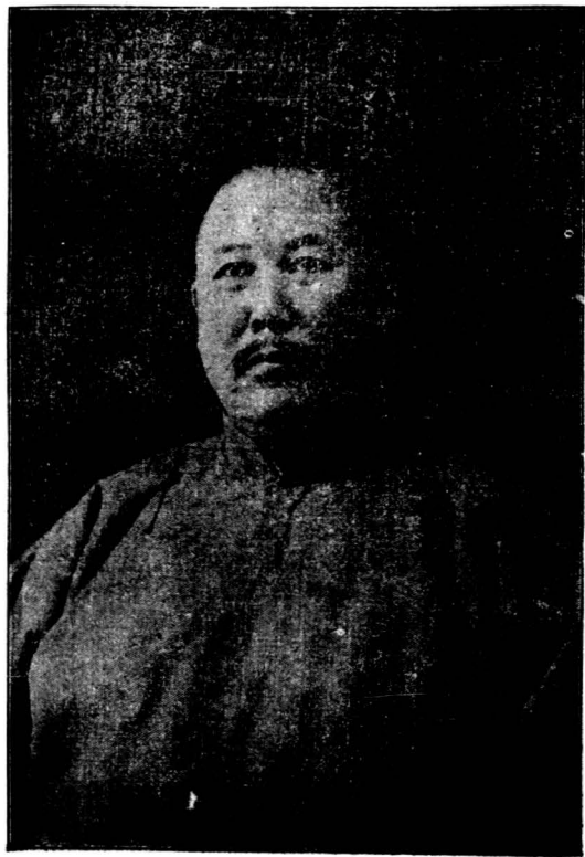
蒙藏委員會委員長馬福祥近影