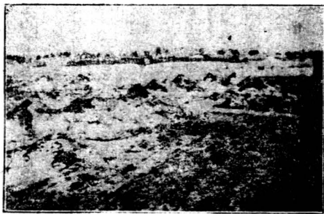
呼倫貝爾蒙古兵營冬季全景