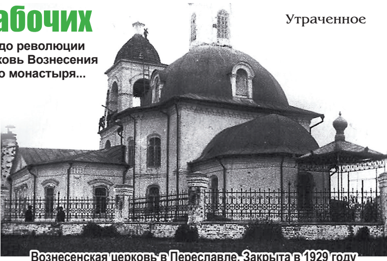
Вознесенская церковь в Переславле. Закрыта в 1929 году