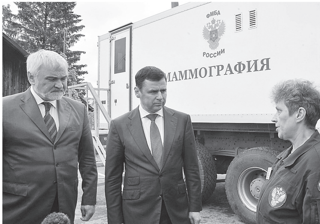
Проект «Мобильная медицина» в Большесельском районе

Достраивается новая школа на 499 учеников в Туношне. Строить ее начали ещё в 2011 году, но через два года работы были заморожены из-за несоблюдения обязательств генподрядчиком. Строительство возобновлено в прошлом году. Увеличение мест в школах позволит ликвидировать вторые смены.