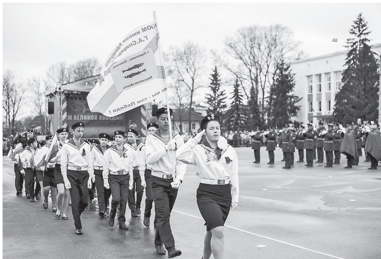
Юные моряки на параде, посвященном Дню Победы