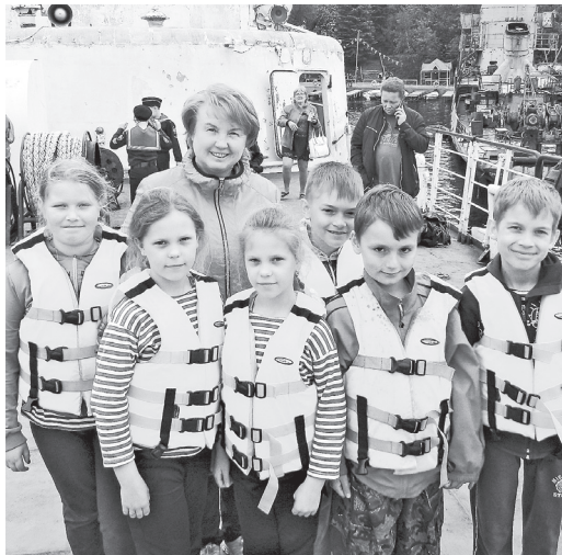
На настоящем боевом корабле