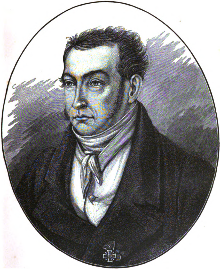
ВАСИЛІЙ ТРОФИМОВИЧЪ НАРЪЖНЫЙ РОД. 1783 г. † 1825 г.