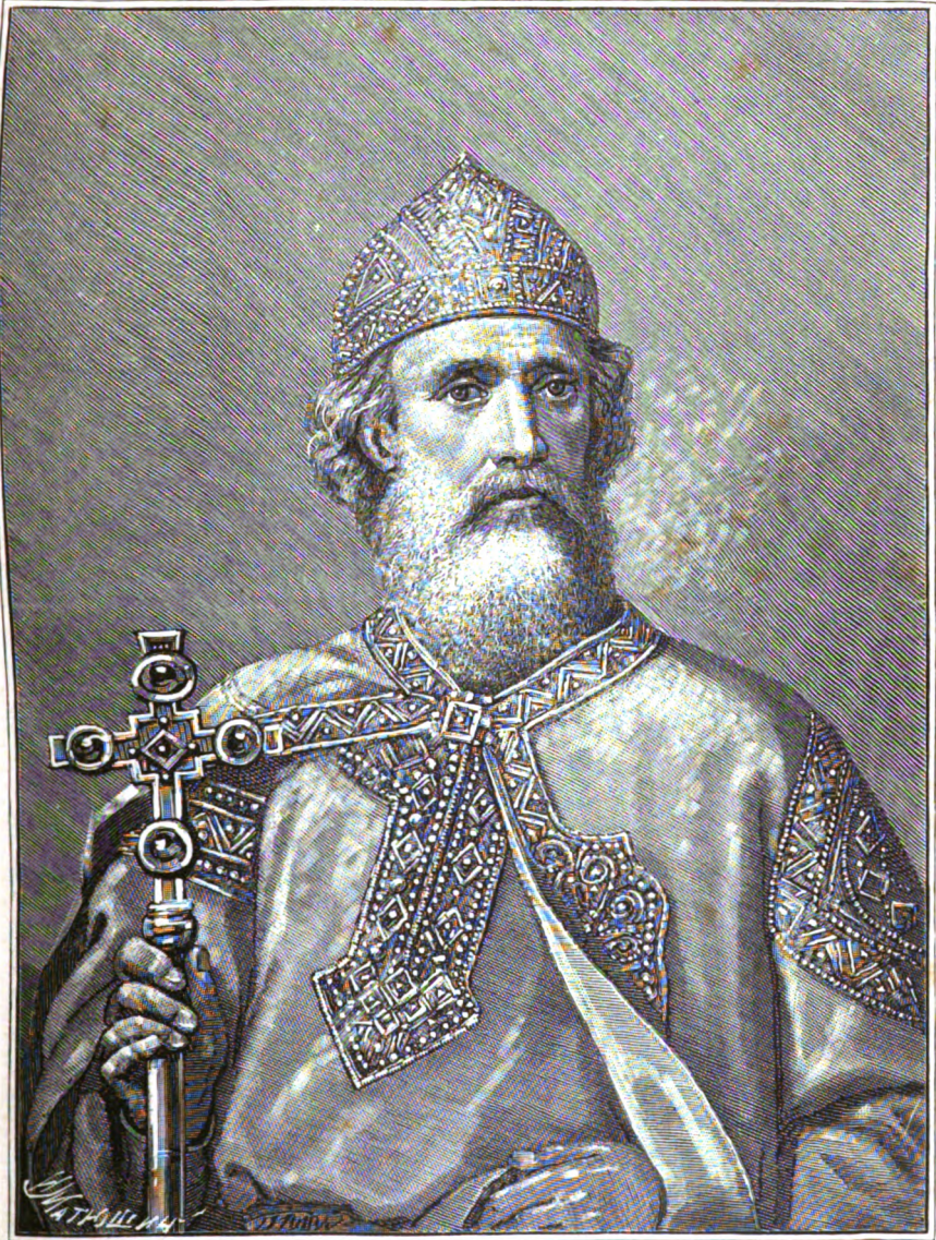
РИСОВАЛЪ ПРОФЕССОРЪ Э. Г. СОЛНЦЕВЪ. ВЕЛИКІЙ КНЯЗЪ ВЛАДИМІРЪ СВЯТОСЛАВИЧЪ, САМОДЕРЖАВСТВОВАЛЪ СЪ 980 ПО 1015 Г.