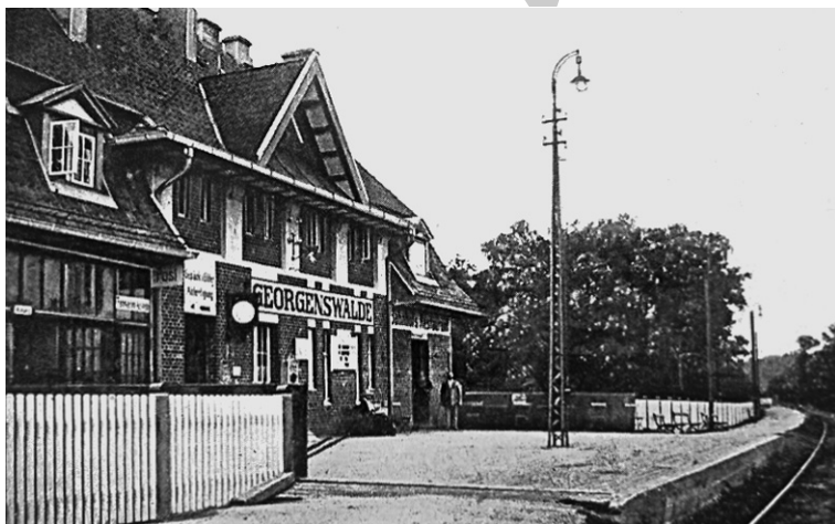
Рис. 10. Георгенсвальде/Отрадное. Железнодорожный вокзал. Арх. М. Щёнвальд. 1912–1913 гг. Фасад со стороны платформы. Georgenswalde. 1629–1929. Festschrift zur 300-Jahrfeier. Auf Grund von Quellen, wissenschaftlichen Darstellungen und vieljaehrigen Beobachtung bearbeitet von G. Klein. Im Auftrage der Gemeinde des Ostseebades und der Villenkolonie Georgenswalde. 1929

тые на высоту трех этажей пилястры, завершенные стилизованными капителями со свисающими лепными листочками. Лепные изображения ов (яйцеобразного орнаментального мотива) украшают рельефные вставки под окнами последнего этажа.