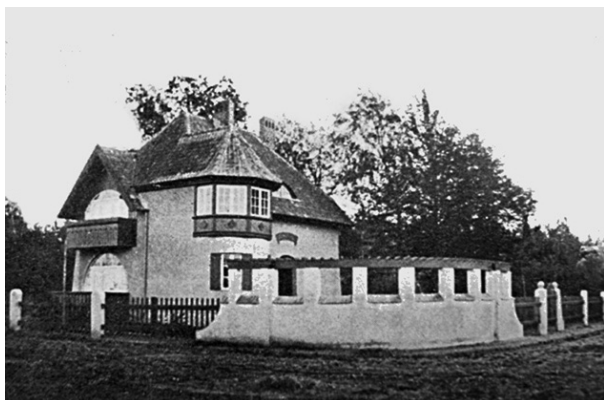
Рис. 17. Георгенсвальде/Отрадное. Вилла «Хельга». Арх. и дата строительства не выявлены. Из: Ostseebad und Villenkolonie Georgenswalde (Ostpreußen). Station der Samlandbahn. Б. м., б. г.

остается популярным в этом регионе у частных заказчиков и в наши дни. Дом имеет свободный план, четыре асимметричных фасада значительно отличаются один от другого. Разновысокие черепичные вальмовые, полувальмовые и мансардные крыши над каждой пространственной составляющей архитектурной композиции виллы подчеркивают свободу общего решения объемно-пространственной композиции. Использование яркой черепицы, белых гладко оштукатуренных стен, деревянных веранд и балконов вносит эффект нарядности в живописный облик здания. (Ныне здесь размещается отделение детского пульмонологического санатория.)