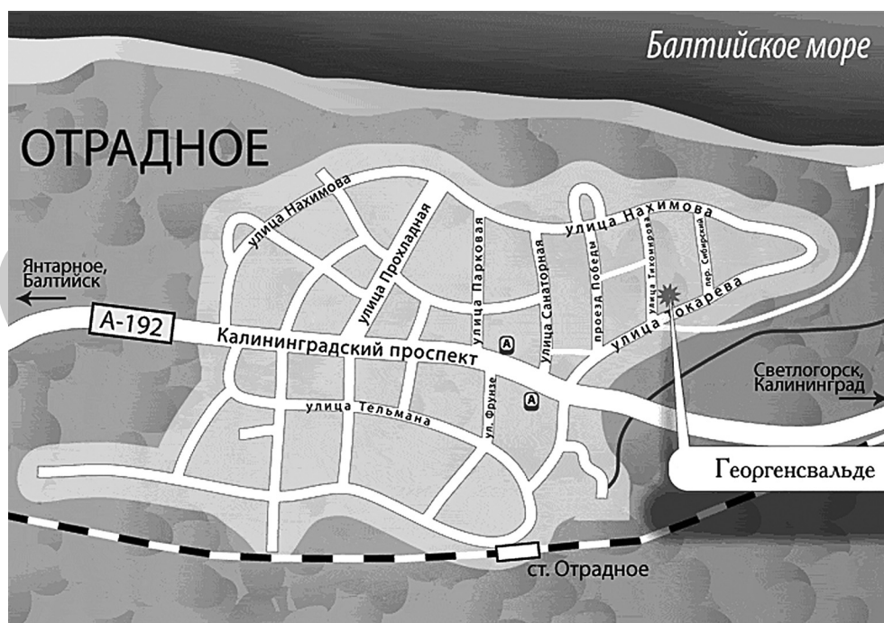
Рис. 2. Отрадное. Современный план поселка

строили не временные летние домики из легких и дешевых материалов, как это было распространено в начале XX в. в Восточной Пруссии, а монументальные общественные и жилые здания. В рекламе земельных участков особо подчеркивалось наличие хорошего отопления, а для приятного проведения времени зимой в одном из оврагов, ведущих к морю, был создан специально оборудованный подъемником спуск для катания на санях и лыжах.