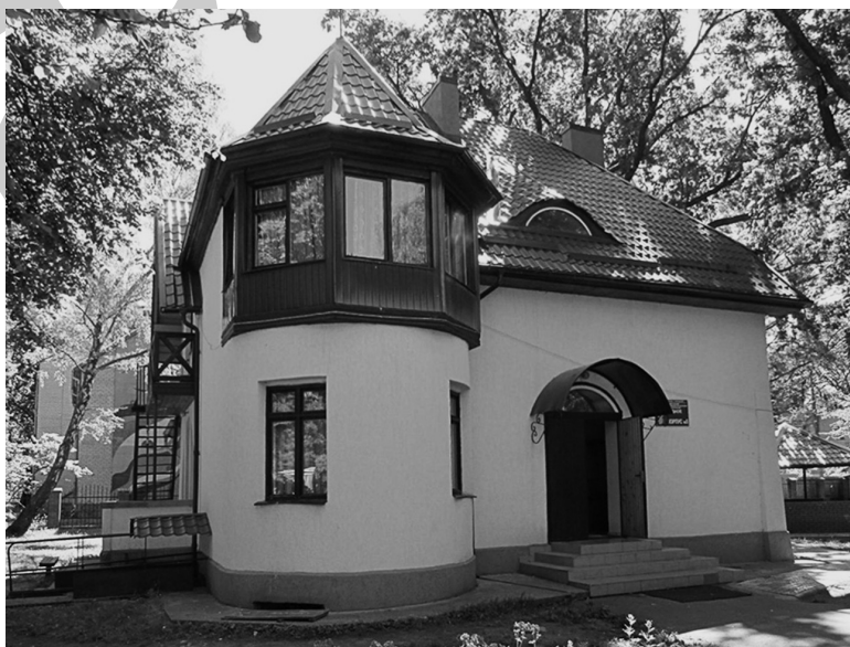
Рис. 16. Георгенсвальде/Отрадное. Вилла «Хельга». Арх. и дата строительства не выявлены. Ныне — корпус детского пульмонологического санатория. 2010 г.

Типичным образцом местного строительства служит вилла «Хельга», которая сохранилась до наших дней с незначительными изменениями, например отсутствует каменная скругленная часть ограждения территории сада, керамическая черепица заменена металлической, вставлены современные пластиковые окна (1908–1914 гг., архитектор не выявлен, рис. 17) 49 . Здание демонстрирует признаки югендстиля балтийского побережья, который