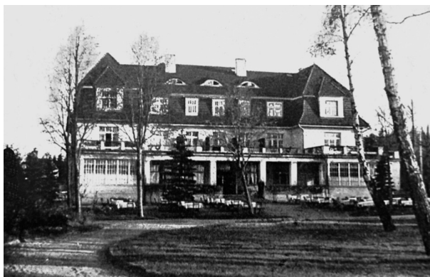
Рис. 6. Георгенсвальде/Отрадное. Курхаус. Садовый фасад. Арх. О. В. Куккук. 1913 г. Из: Georgenswalde. 1629–1929. Festschrift zur 300-Jahrfeier. Auf Grund von Quellen, wissenschaftlichen Darstellungen und vieljaehrigen Beobachtung bearbeitet von G. Klein. Im Auftrage der Gemeinde des Ostseebades und der Villenkolonie Georgenswalde. 1929

высокими деревьями, закрывающими вид на море, а лестница к пляжу отсутствует.