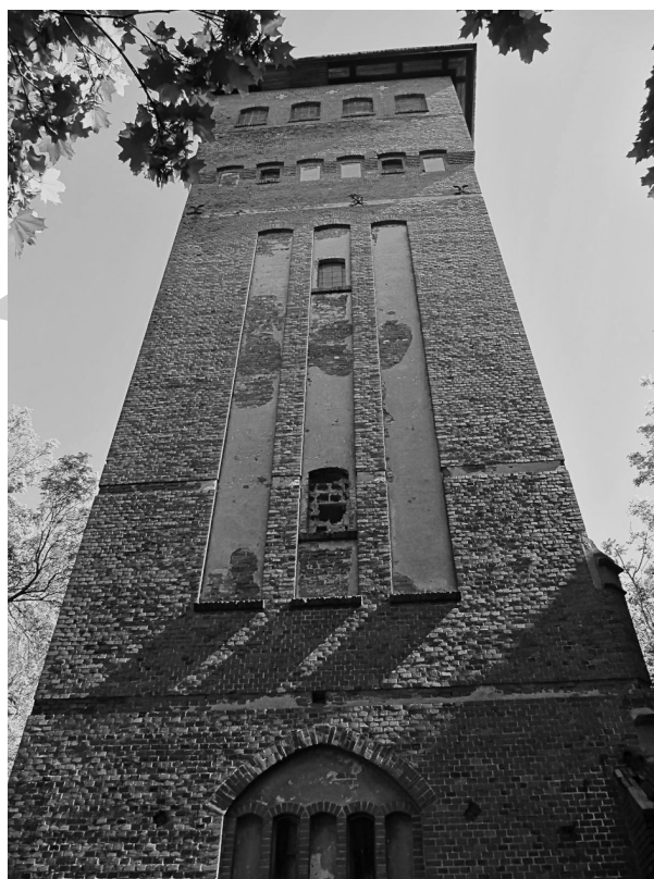
Рис. 12. Георгенсвальде/Отрадное. Водонапорная башня. Арх. (?) Фишер. 1909 г. 2010 г.

Если в городах того времени единообразие при строительстве домов-блоков рассматривалось как панацея от социальных бед, способ решения жилищных проблем, то курорт давал возможность дифференцированного подхода к организации форм жизни, в зависимости от социального и финансового