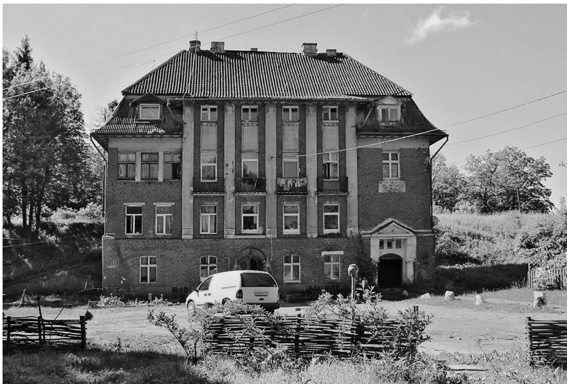
Рис. 9. Георгенсвальде/Отрадное. Железнодорожный вокзал. Арх. М. Щёнвальд. 1912–1913 гг. Вид со стороны поселка. 2010 г.