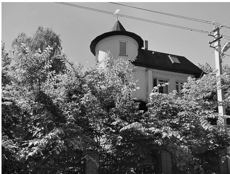
Рис. 15. Георгенсвальде/Отрадное. Кондитерская «Вид на море». Арх. и дата строительства не выявлены. Ныне жилой дом. 2010 г.

Местные архитекторы обращаются к художественным формам нового стиля, используя его английскую модель, получившую большое распространение в Германии благодаря публицистике известного архитектора Германа Мутезиуса, в 1896–1905 гг. исполнявшего обязанности технического атташе при немецком посольстве в Лондоне. Его трехтомная книга «Английский дом. Развитие, парковые условия, возведение, оборудование и внутреннее пространство», вышедшая несколькими изданиями в начале XX в. (первое издание 1904 г.), оказала влияние на популяризацию английских образцов движения «Искусств и ремесел» и формирование стилистики модерна 48 .