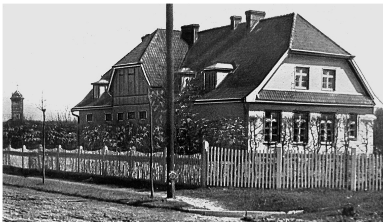
Рис. 13. Георгенсвальде/Отрадное. Арх. П. Раабе. Школа. 1913 г., перестройка 1926 г. Из: Georgenswalde. 1629–1929. Festschrift zur 300-Jahrfeier. Auf Grund von Quellen, wissenschaftlichen Darstellungen und vieljaehrigen Beobachtung bearbeitet von G. Klein. Im Auftrage der Gemeinde des Ostseebades und der Villenkolonie Georgenswalde. 1929

положения клиента, возрастной категории пользователей. Индивидуальное решение архитектурных объектов соответствовало идее создания неповторимого лица курортного поселения — приватный заказ выражал личность человека, импонировало его вкусам и пристрастиям, стремлению следовать моде или сложившимся традициям.