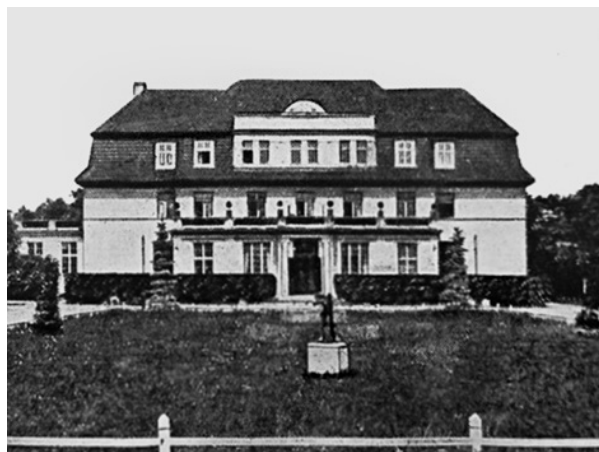
Рис. 4. Георгенсвальде/Отрадное. Курхаус. Общий вид со стороны колонии. Арх. О. В. Куккук. 1913 г. Из: Georgenswalde. 1629–1929. Festschrift zur 300-Jahrfeier. Auf Grund von Quellen, wissenschaftlichen Darstellungen und vieljaehrigen Beobachtung bearbeitet von G. Klein. Im Auftrage der Gemeinde des Ostseebades und der Villenkolonie Georgenswalde. 1929

Фасад, обращенный к саду и морскому берегу, был не менее выразителен, нежели выходящий в сторону колонии (рис. 6). До сего дня частично