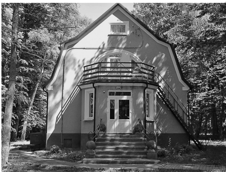
Рис. 18. Георгенсвальде/Отрадное. Вилла «Хелена». Арх. П. Раабе. Дата строительства не выявлена. Ныне — корпус детского пульмонологического санатория. 2010 г.

остается популярным в этом регионе у частных заказчиков и в наши дни. Дом имеет свободный план, четыре асимметричных фасада значительно отличаются один от другого. Разновысокие черепичные вальмовые, полувальмовые и мансардные крыши над каждой пространственной составляющей архитектурной композиции виллы подчеркивают свободу общего решения объемно-пространственной композиции. Использование яркой черепицы, белых гладко оштукатуренных стен, деревянных веранд и балконов вносит эффект нарядности в живописный облик здания. (Ныне здесь размещается отделение детского пульмонологического санатория.)