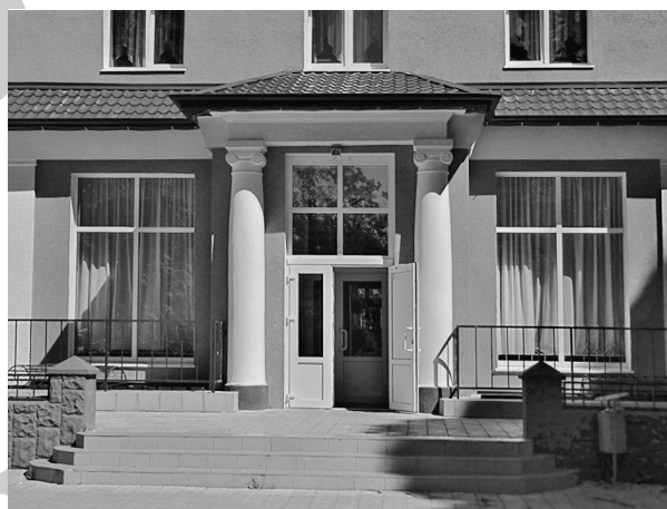
Рис. 5. Георгенсвальде/Отрадное. Курхаус (ныне корпус детского пульмонологического санатория). Арх. О. В. Куккук. 1913 г. Портал. 2010 г.

сохранились два боковых ризалита, между которыми на первом этаже разместилась крытая веранда (рис. 7). Наличие веранды — обязательная составляющая курортного сооружения на Балтике. Ее появление в Европе обусловлено связями с американской культурой сельского строительства, откуда и был заимствован этот архитектурный элемент. Как свидетельствуют старые изображения, до Первой мировой войны веранда курортного дома открывалась непосредственно в небольшой сад, за которым находился крутой береговой обрыв и разворачивался великолепный вид на просторы моря. Вдоль обрыва узкая лестница вела непосредственно к песчаному пляжу. В настоящее время сад зарос