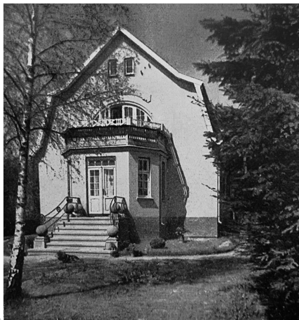
Рис. 19. Георгенсвальде/Отрадное. Вилла «Хелена». Арх. П. Раабе. Дата строительства не выявлена. Из: Georgenswalde. 1629–1929. Festschrift zur 300-Jahrfeier. Auf Grund von Quellen, wissenschaftlichen Darstellungen und vieljaehrigen Beobachtung bearbeitet von G. Klein. Im Auftrage der Gemeinde des Ostseebades und der Villenkolonie Georgenswalde. 1929

Непременный признак приморской виллы начала XX в. — наличие башенок, эркеров, балконов, веранд. Веранды и лоджии, широко распространились в архитектуре курортов Германии под влиянием новых идей американских архитекторов «гонтового стиля» и ее представителя Х. Х. Ричардсона, спровоцировавших новую «верандную» культуру в балтийском регионе. В Самбии веранды устраивались не только на нижних этажах, но, как например в вилле «Хельга», размещались на вершине башен таким образом, чтобы из помещения веранды открывался хороший круговой обзор.