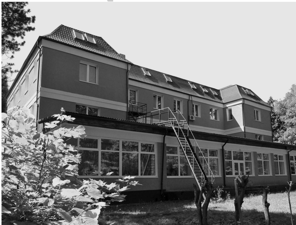
Рис. 7. Георгенсвальде/Отрадное. Курхаус (ныне корпус детского пульмонологического санатория). Арх. О. В. Куккук. 1913 г. Садовый фасад. 2010 г.

Статья интересна описанием утраченного интерьера курортного дома. Ф. Р. Фогель отмечает единство внутренней планировки здания, ядром которого был просторный зал, объединяющий остальные помещения и дающий возможность их обзора 32 . Из зала как геометрического и смыслового центра нижнего этажа, «словно щупальца», расходятся во все стороны соседние пространства. Помещение зала повышено на три ступени по сравнению с соседними комнатами, которые примыкают посредством поперечного коридора. «Эти три ступени между балюстрадой вестибюля — выдающаяся композиционная находка, настолько неожиданно они появляются» 33 (рис. 8). Ступени служили приглашением пестрому сообществу посетителей включиться в атмосферу отдыха и радости, царивших