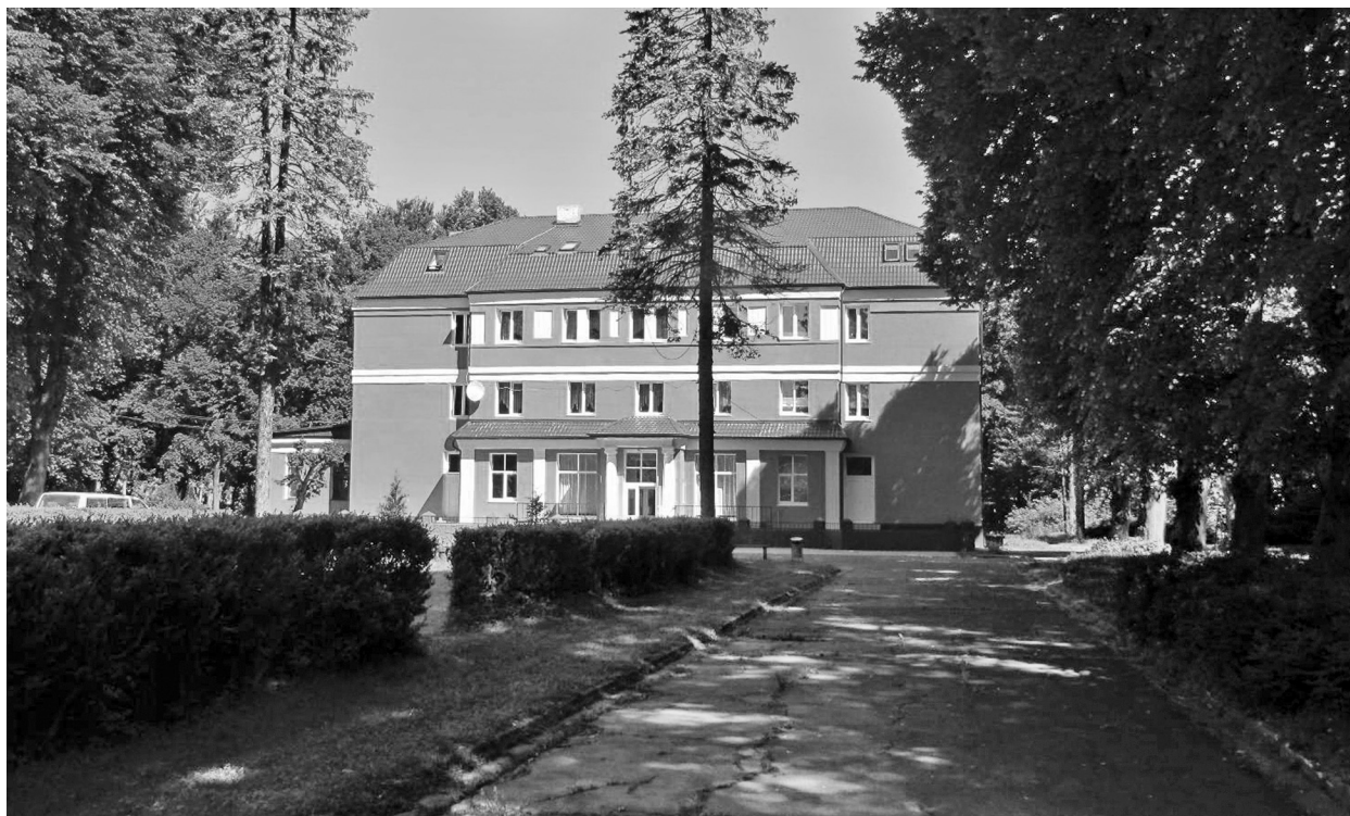
Рис. 3. Георгенсвальде/Отрадное. Курхаус (ныне корпус детского пульмонологического санатория). Арх. О. В. Куккук. 1913 г. 2010 г.

размерами, внешней выразительностью и многофункциональностью, предполагавшей наличие разнообразных помещений общественного пользования. Согласно сложившейся еще в XIX в. традиции, здание должно было объединять гостиницу, ресторан, читальный зал, бильярдную комнату, залы для различных игр (например, карточных) и другие общедоступные помещения. Непременным условием присвоения зданию наименования «курхаус» было наличие большого вместительного зала для проведения многочленных встреч, балов, празднеств. Главное сооружение курорта могло принадлежать городской общине или частному владельцу.