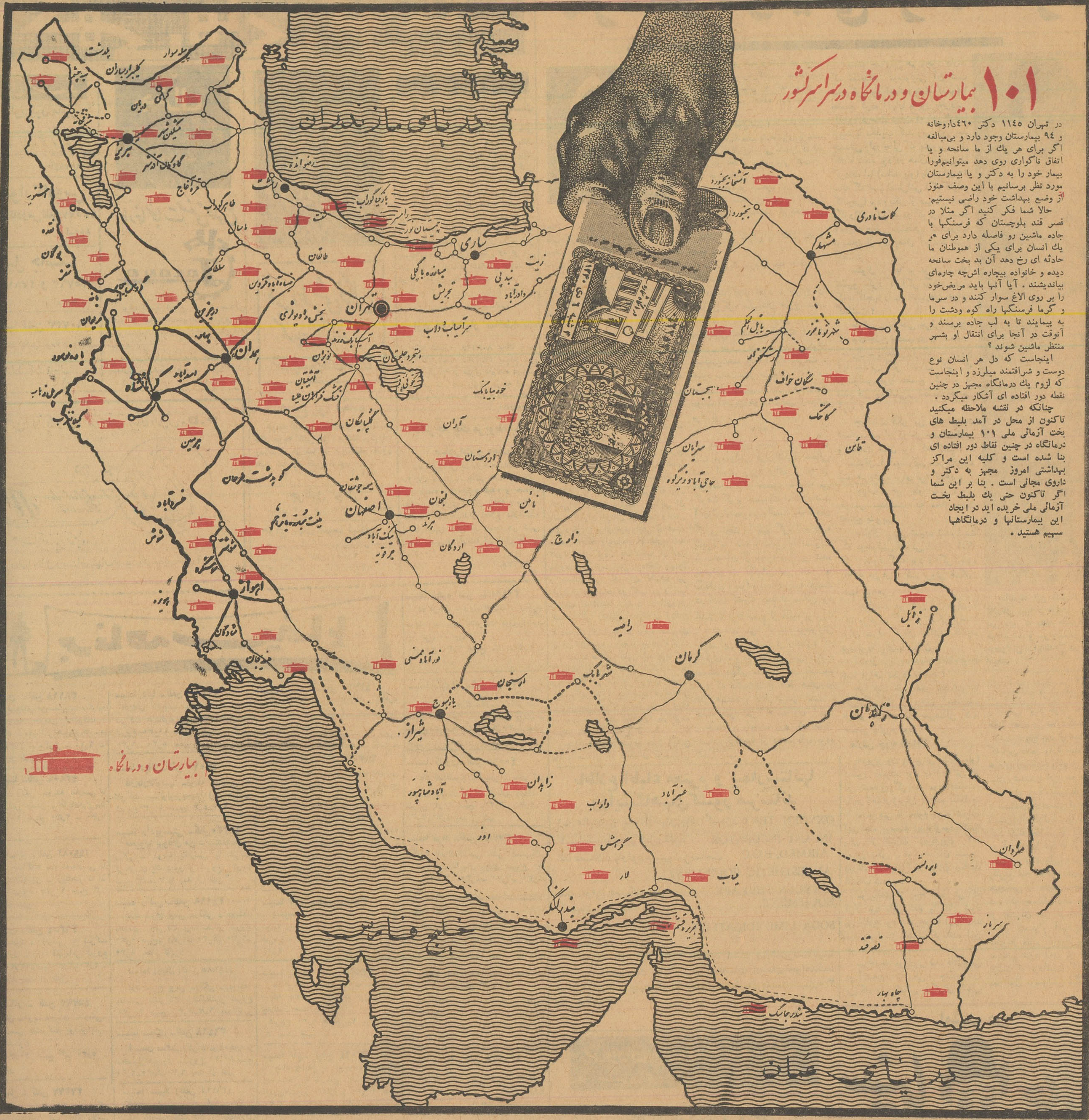
بیمارستان و درمانگاه

شما اگر تاکنون حتی یک بلیط بخت آزمائی ملی خریده اید