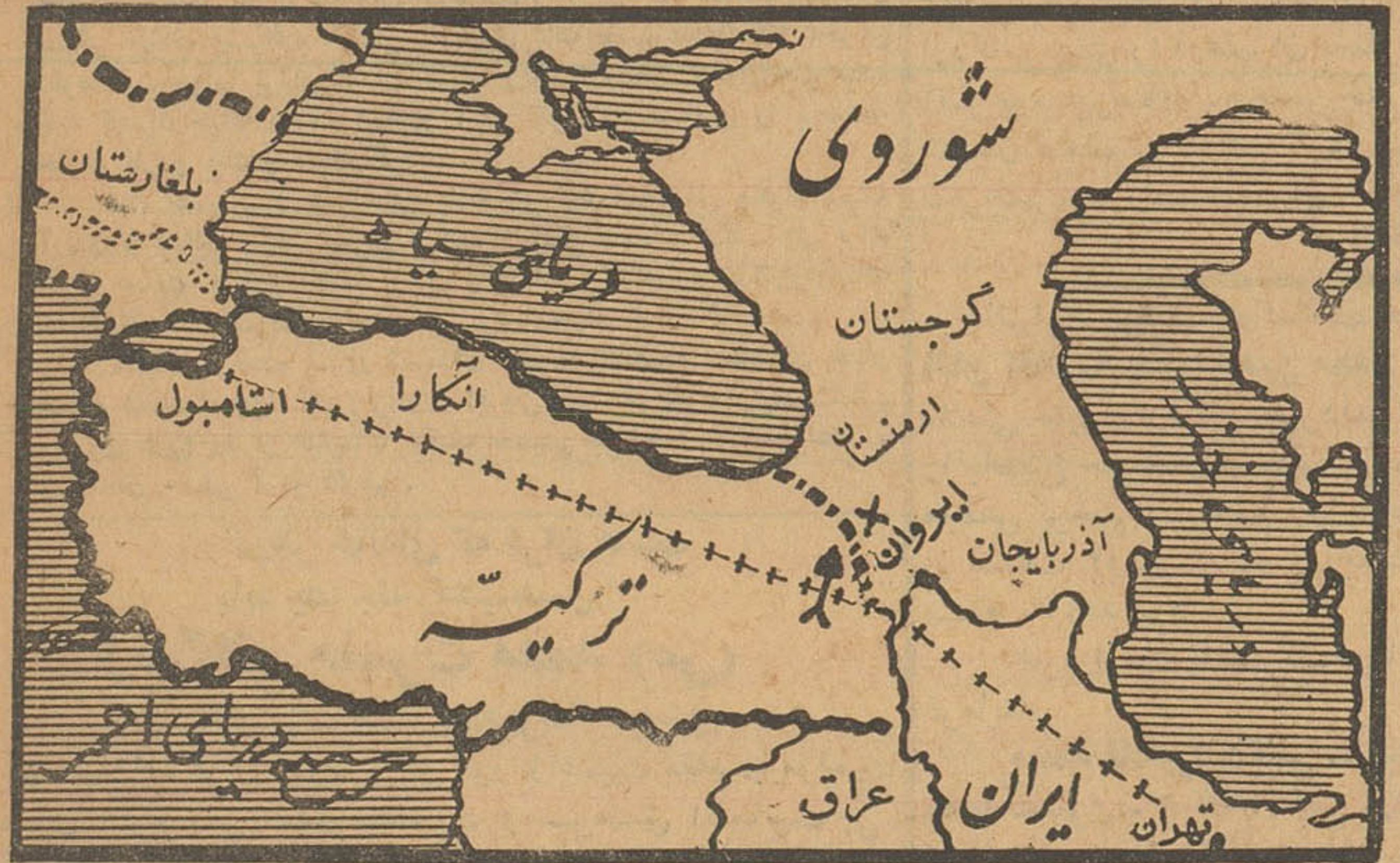
در این نقشه مسیر هواپیما از تهران باستانبول و محل انحراف آن دیده میشود.

هواپیما سلامت در فرودگاه ایروان فرود آمده است