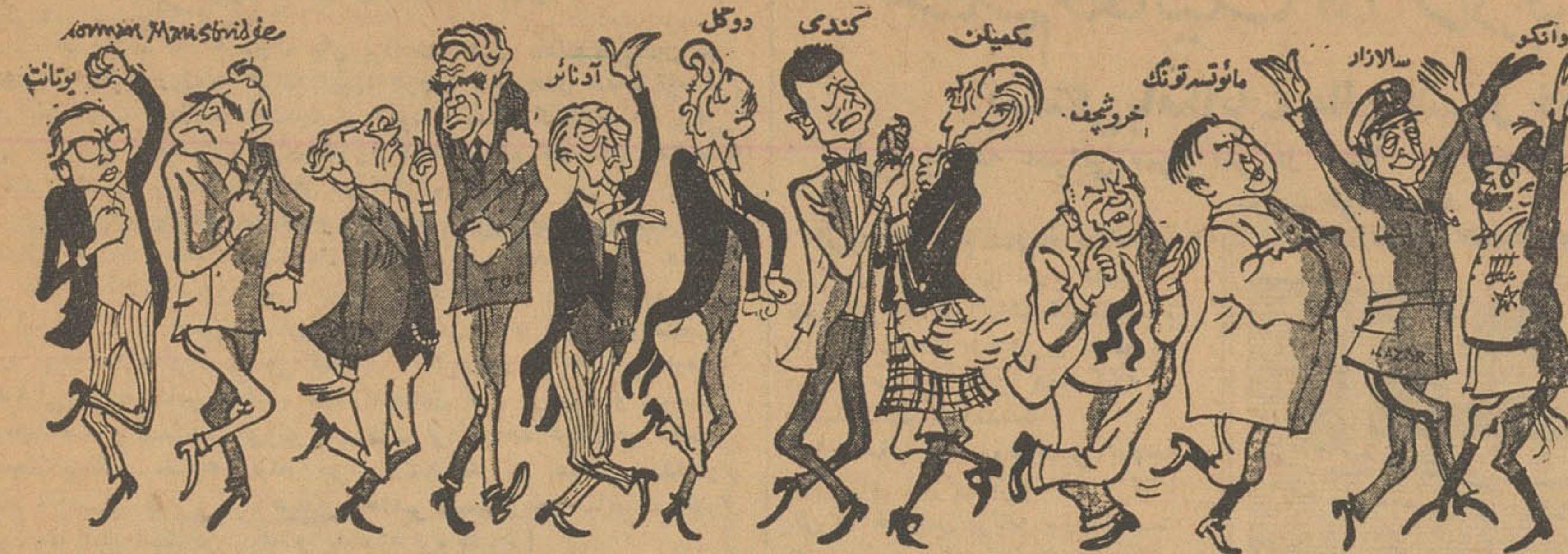
کاریکاتور از ساندی تایمز چاپ لندن