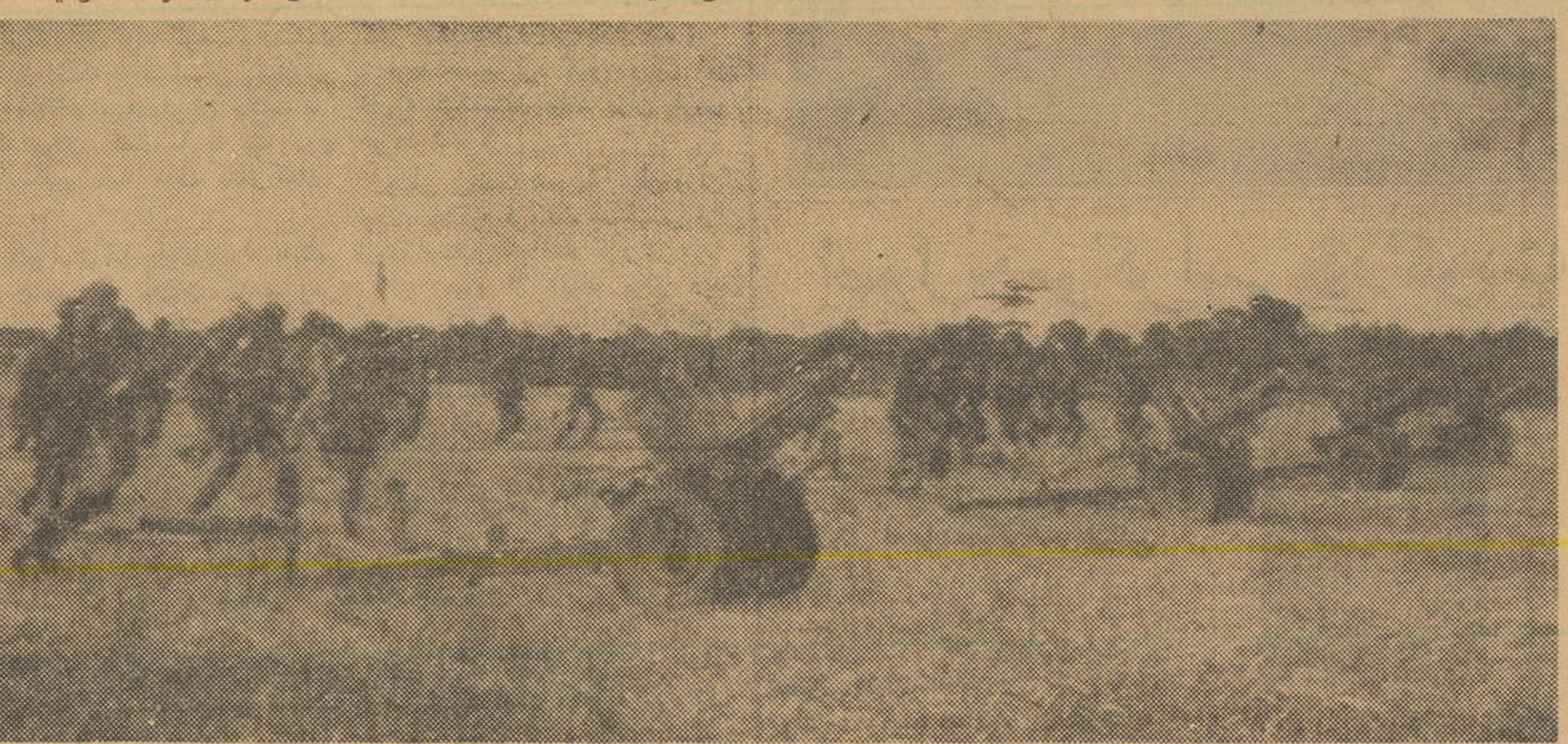
سربازان تویخانه اندونزی مشغول تمرین هستند تا برای حمله به گینه جدید و تصرف آن آمادگی پیدا کنند. در چاکارتا شایع است که ارتش اندونزی بطور پنهانی ۲۵۰ هزار از نیروهای نظامی خود را در شرق اندونزی بجا آماده باش نگهداشته تا بوسیله آنها گینه جدید را تصرف نماید.

کراچی - یونایتدپرس - ۸ ژانویه - یو.سی. فرادای که امروز یسین انگلستان و پاکستان اعضاء شد دولت انگلستان ۷ میلیون لیره انگلیسی به پاکستان وام خواهد داد. این وام صرف خرید ماشین آلات و تجهیزات لازم برای برنامه دوم پاکستان از انگلستان خواهد شد. قرارداد مذکور بین وزیر دارائی پاکستان و کمیسر های انگلیس با اعضاء رسیده است.