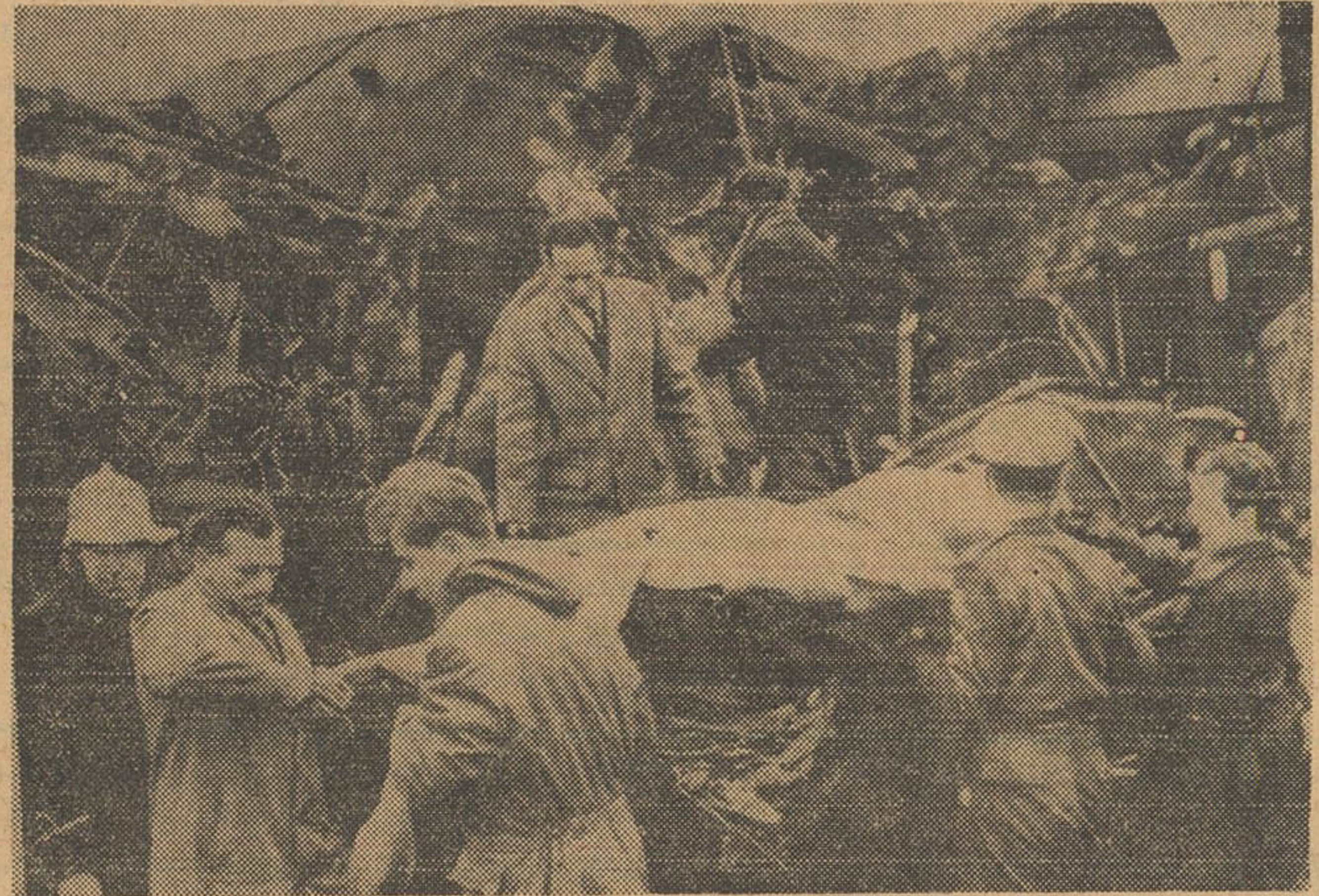
بدینال حادثه وحشتناک تصادم دو ترن در هلند نتیجه نجات به محل حادثه شافته زخمیها و اجساد کشته شدگان را از زیر قطعات متلاشی واگن ها بیرون می کشند. عکس رادیویی اطلاعات شرح در صفحه پانزدهم

دو قطار سریع السیر تصادم کردند و در نتیجه صحنه فجیعی بوجود آمد که صد ها نفر تلفات آن بود