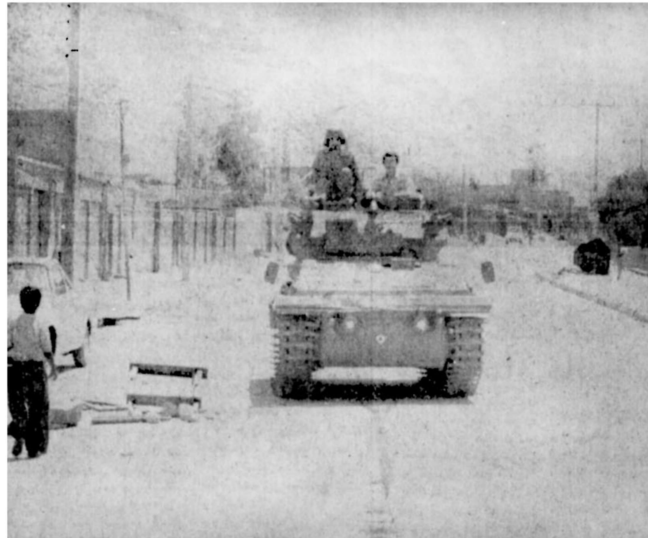
رفتو آمد در سقز به حداقل رسیده است و نیرو های نظامی که ضد انقلاب را بیرون راندند با پشتیباری از شهر پاسداری میکنند.