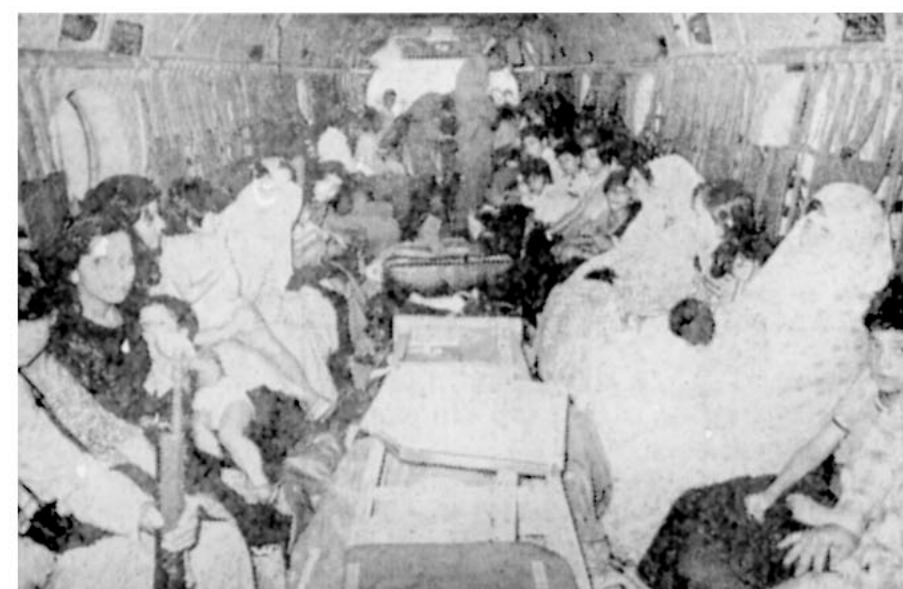
انتقال زنها و بچه ها نیرو های ارتش جمهوری اسلامی در اولین فرصت ممکن، زنها و بچه هارا با هلیکوپتر های غول بگر از میدان نبرد دور کردند و به مناطق امن انتقال دادند.

حراج پنجره پاریس شامل لباسهای تابستانی و زمستانی از شنبه ۳ شهریور مصدق - پائین تر از کورش پنجره پاریس