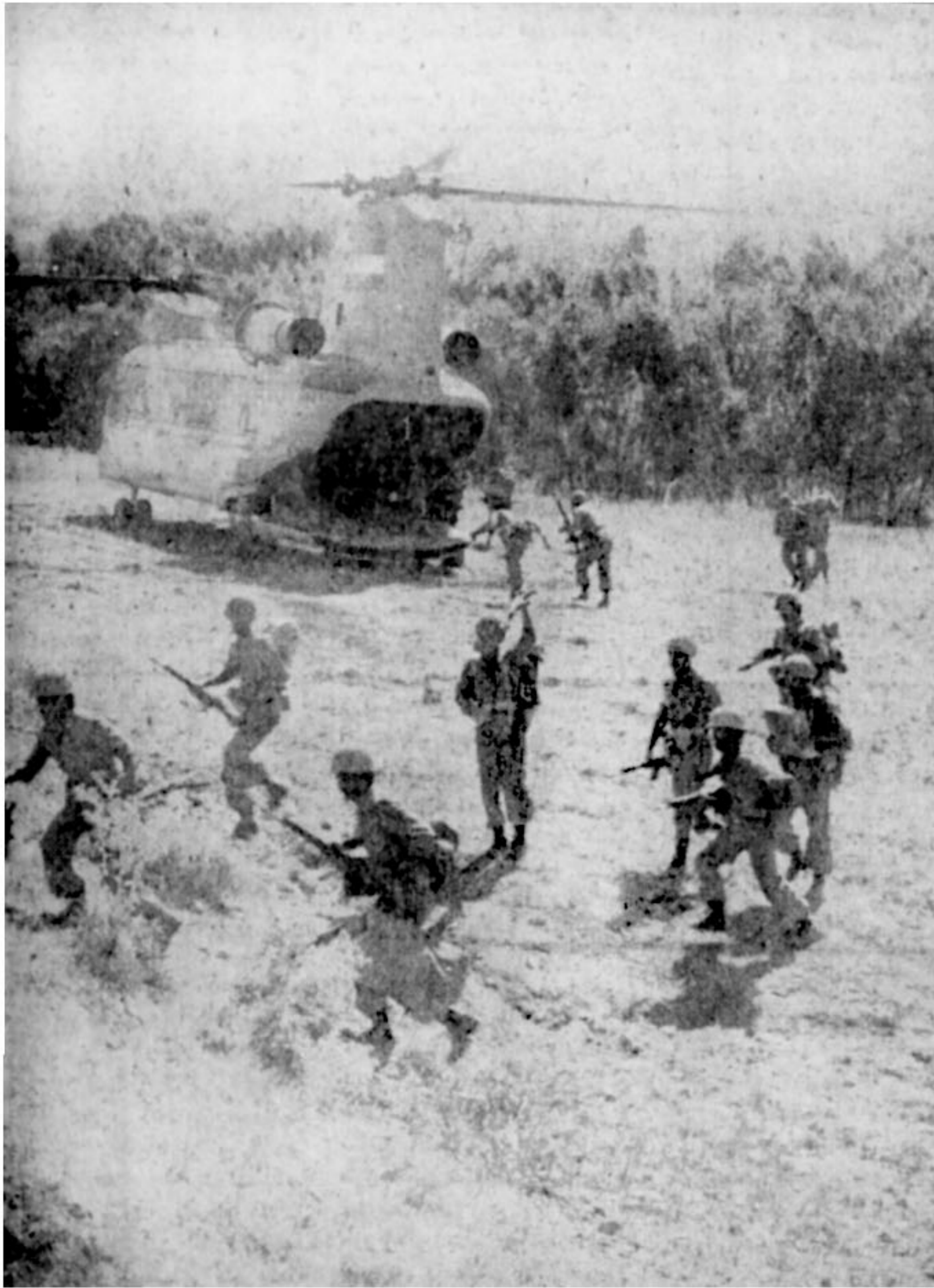
آغاز تقویت نیرو پس از درگیری های روز چهارشنبه و شنبه شهر جنگنده سقز اعزام شدند عکس، پیاده شدن یک گروه از نیرو های کتکی بسقز را از هلیکوپتر نشان میدهد.