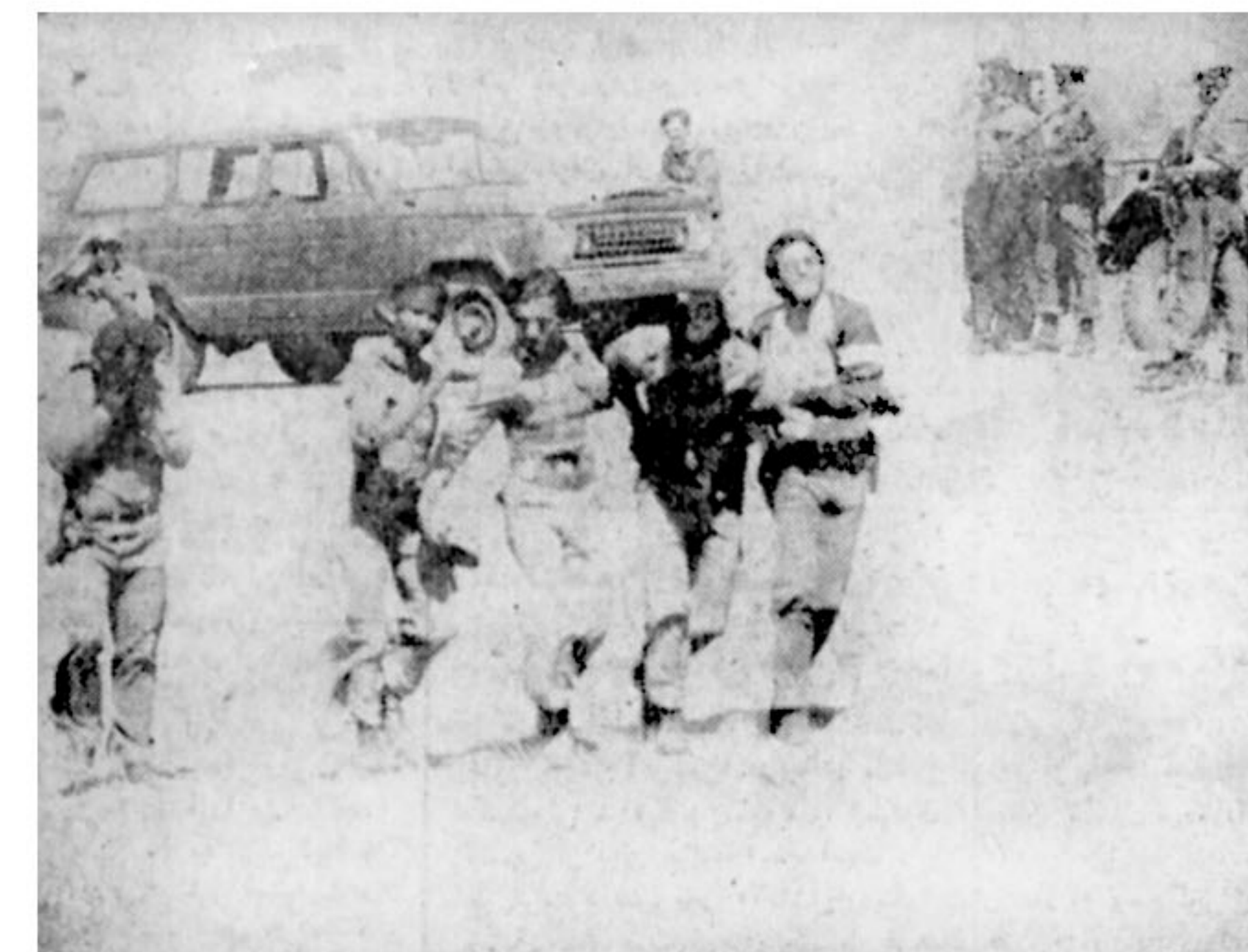
انتقال مجروح ضد انقلاب و استعمار این وضع را بوجود آورده صورتش را در دست ها پنهان کرده و می گرد.

بعد مردم دیدند که پسر مدغم خان، با بکار گرفتن شیوه های جدید شکنجه و وحشت، آن نوع دیکتاتوری را در ایران مستقر کرد که داد اربابان خودش را هم در آورد و آمدند و بردندش.