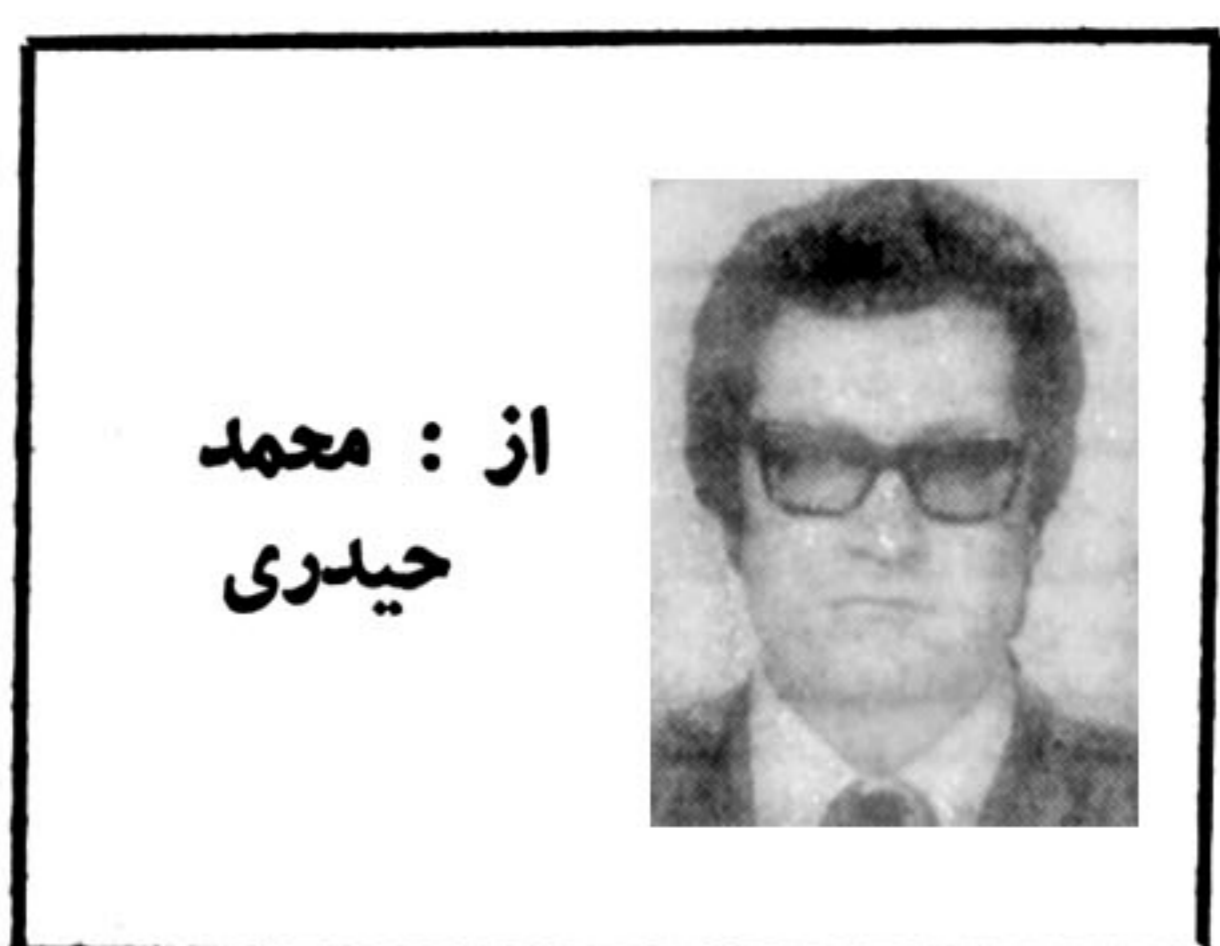
از: محمد حیدری

این مفسر که ما قیلاو را آدمی بی‌غرض و محقق می‌شناختیم، در چاتی از سلسله مقالات خود، از قول یکی از میهمانان همان ضیافت می‌نویسد: (ما خیال نمی‌کردیم «ملاها» به شیوه کمونیست‌ها عمل کنند...)