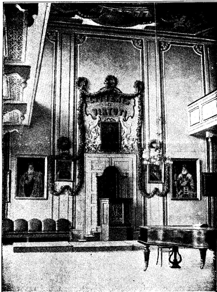
Frontul sălii festive a gimnasiului.

Și dacă-mi întetesc privirea căutând a străbate prin vremuri până la acel timp clasic de muncă desinteresată, insuflețire ideală și frățească unire, — din umbra vremilor trecute îmi resare înaintea ochilor