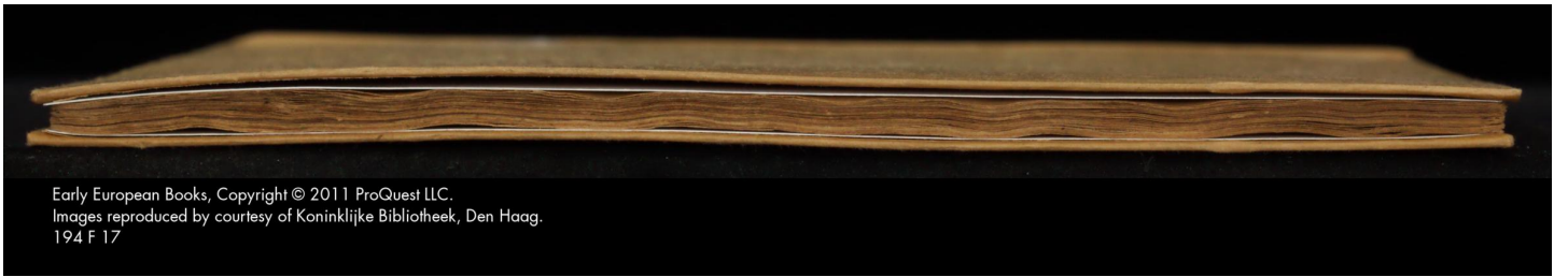
194 F 17