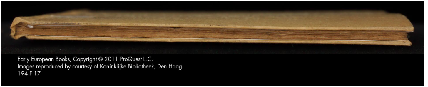
194 F 17