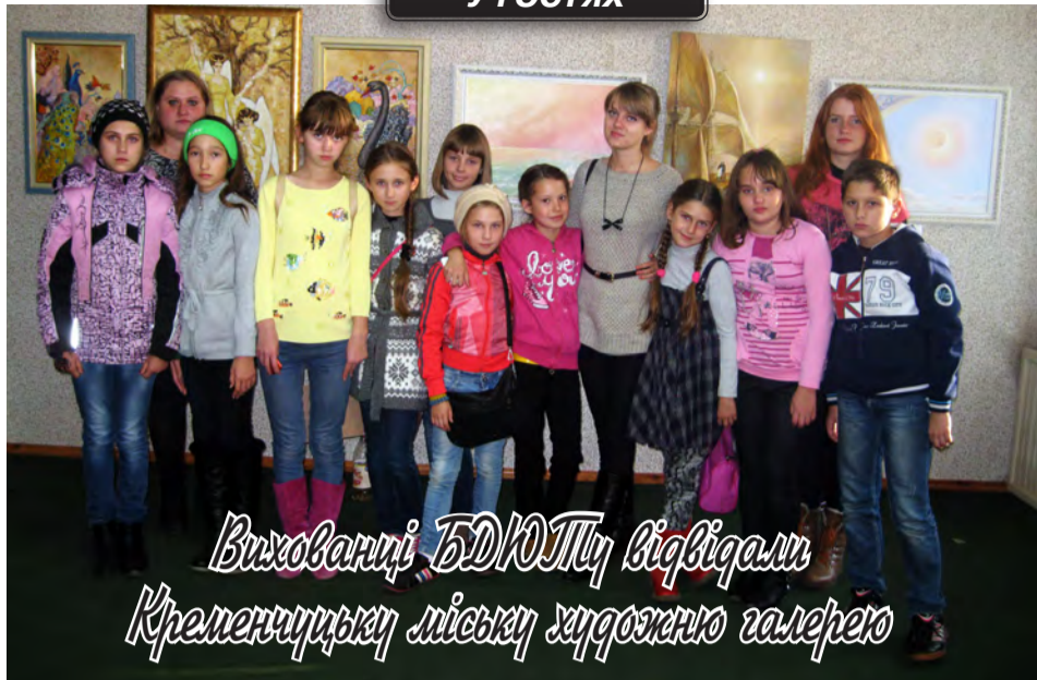
Вихованці БДЮТ у відвідали Кременчуцьку міську художню галерею

Осінні канікули — чудова пора зробити перерву у навчанні та відпочити. Зазвичай діти чекають від канікул чогось цікавого, пізнавального, хочуть отримати нові враження. Керівники гуртка «Образотворче мистецтво», художньої студії «Палітра» та гуртка «Бісероплетіння» Козельщинського БДЮТ організували для своїх вихованців екскурсію до міста Кременчука у міську художню галерею. Саме цього дня було закрито виставку картин учнів Мистецької школи «Око» та персональної виставки художниці Оксани Бойко. У галереї нас радо зустрів екскурсовод. Вона розповіла нам про художницю, 100 картин якої були представлені на виставці. Усі вони сповнені теплоти та чуттєвості, відображають ліричну природу жінки-митця.