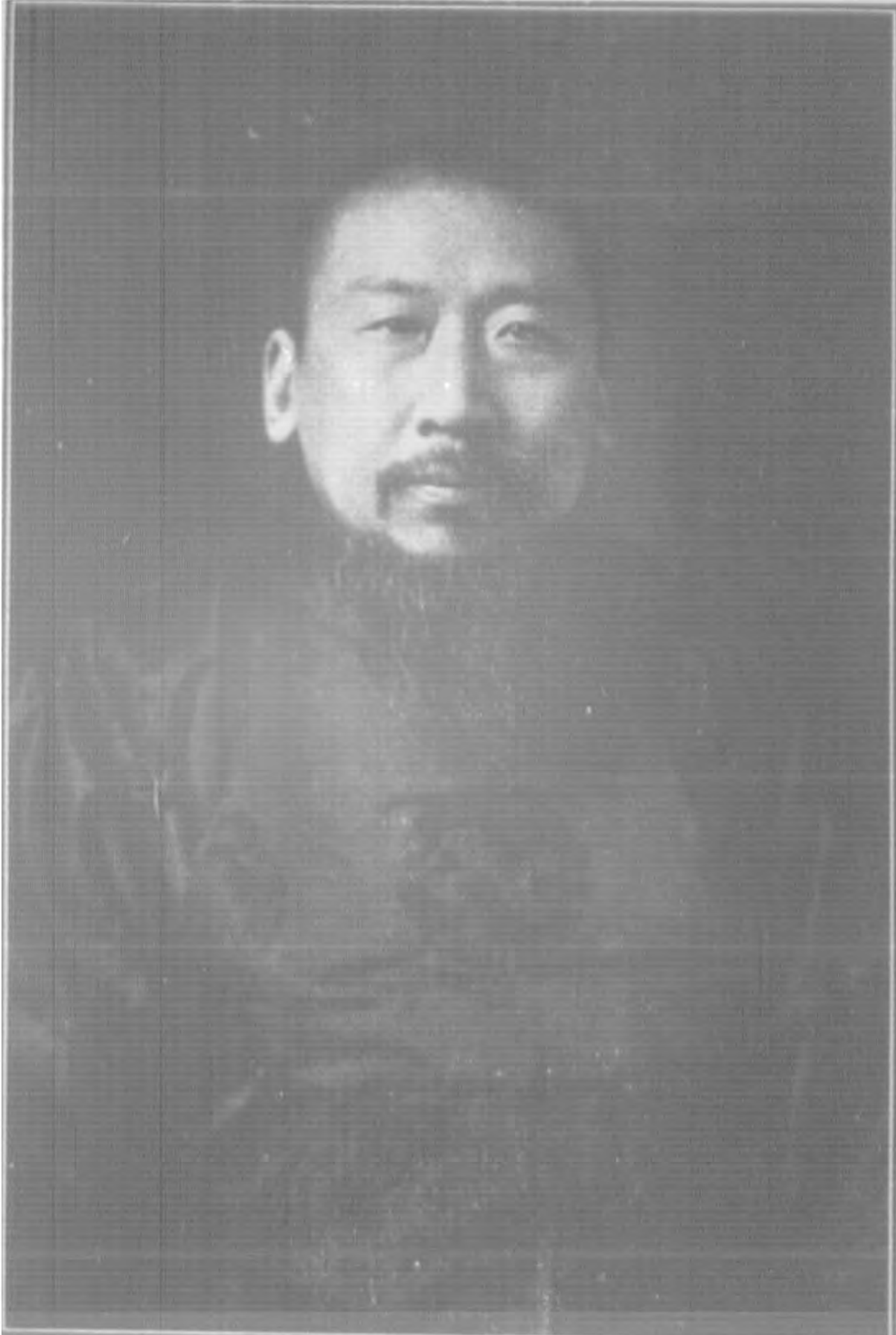
王 委 員 揖 唐