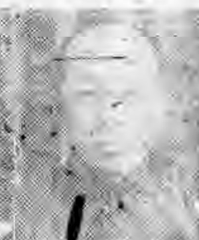
員社社本 池岳川四 初貫劉