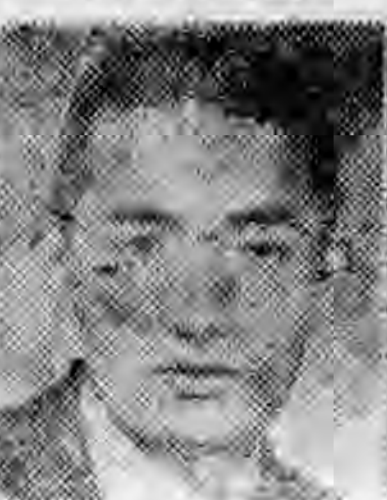
員社社本 浦濱蘇江 經大周