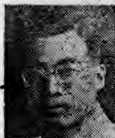
員社社本 京南蘇江 衡玉宋