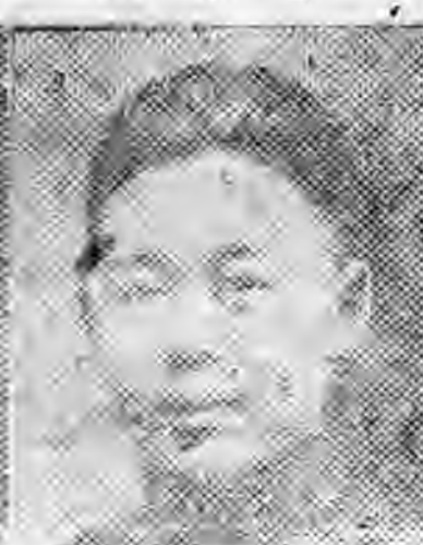
員社社本 縣忻西山 南輝李