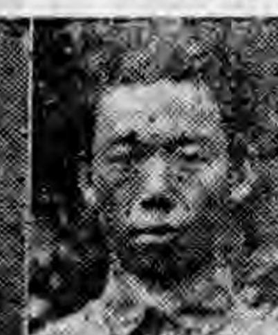
員社社本 利慶川四 倫伯單