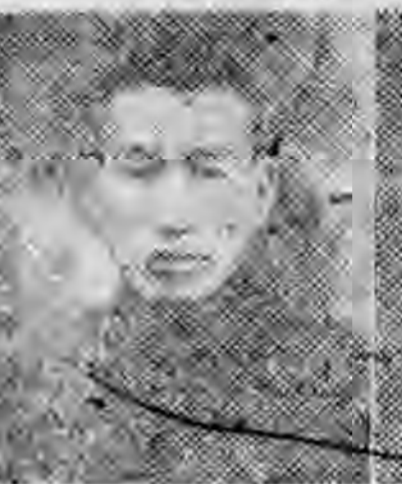
員社社本 谷太西山 儉同安