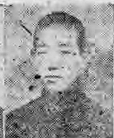
員社社本 陽慶肅甘 晟大陸