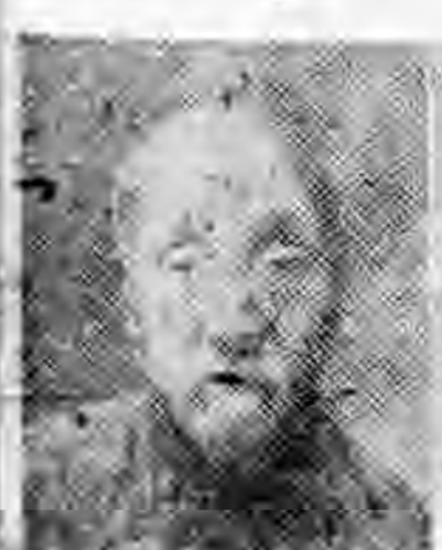
員社社本 鄉良北河 澤程