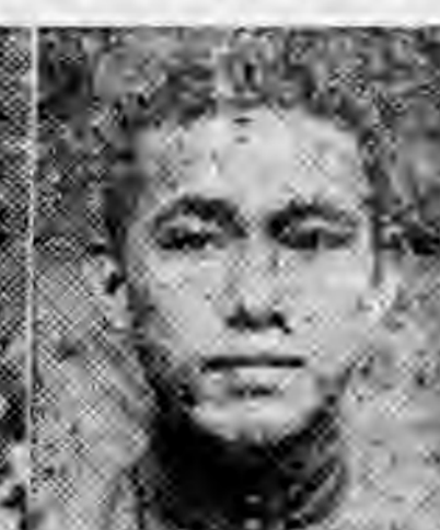
員社社本 安懷省察 全占趙