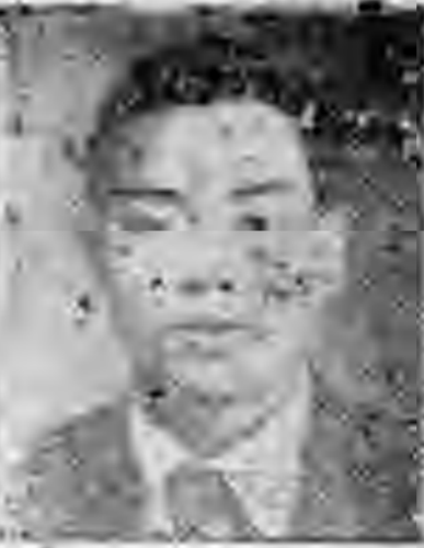
員社社本 平佳西廣 牛桂李