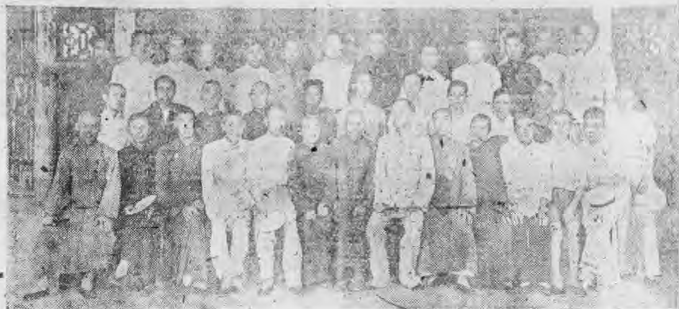
社分威武肅甘 長社分 生先濟伯濟