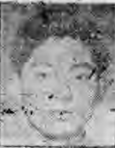
員社社本 錫無燕江 鴻鈔浦