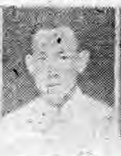
市岡沿西江 長社分 生先生燕陳