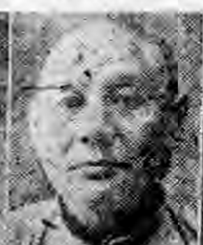
員社社本 寧興東廣 馨煥山