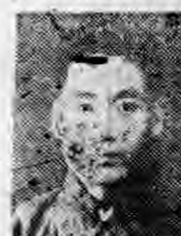
社分店徐北河 任主行推 生先益福王