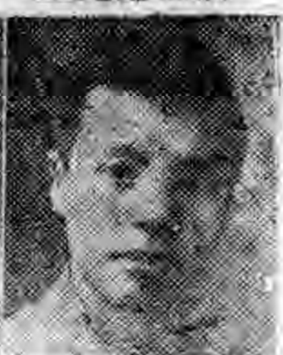
縣昌順建福 長社分 生先齡德蔣