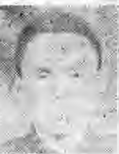
員社社本 鄉泰蘇江 奇顧