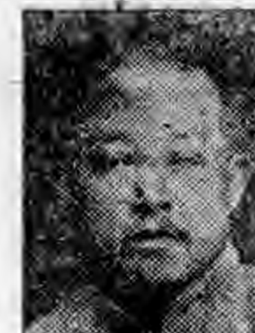
員社社本 興紹江浙 帆肖李