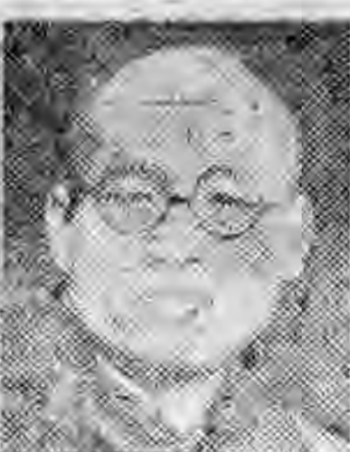
員社社本 原太西山 傑王