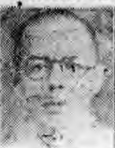
社分滄東廣 任主行推 生先生棣胡