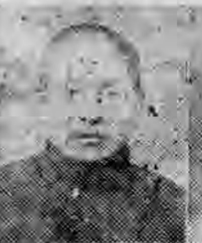
員社社本 州蘭肅甘 鼎省何