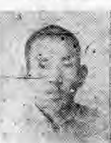
員社社本 春永建福 國喜陳