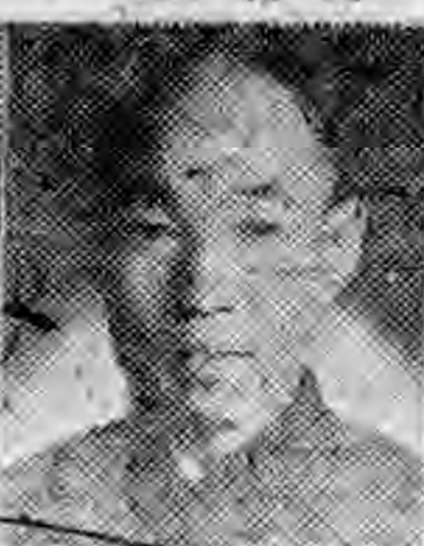
員社社本 定嘉蘇江 生祥陳