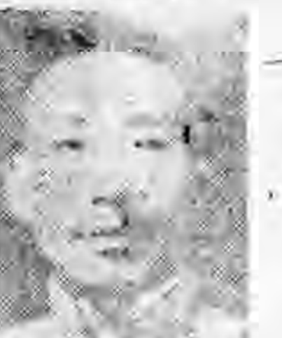
社分慈郭江浙 任主傳宣 生先仙忠李