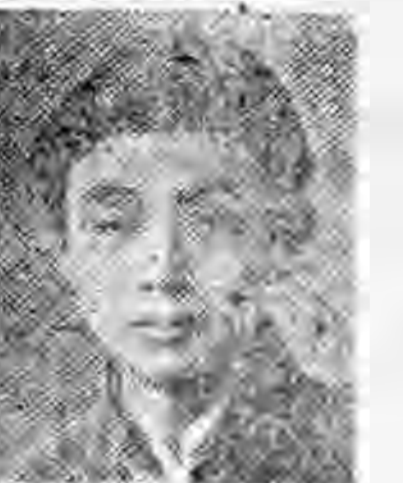
員社社本 城舒徽安 義秉王