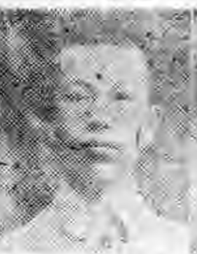
員社社本 郎尋西江 凡生范