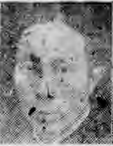
員社社本 森林建福 安子宋