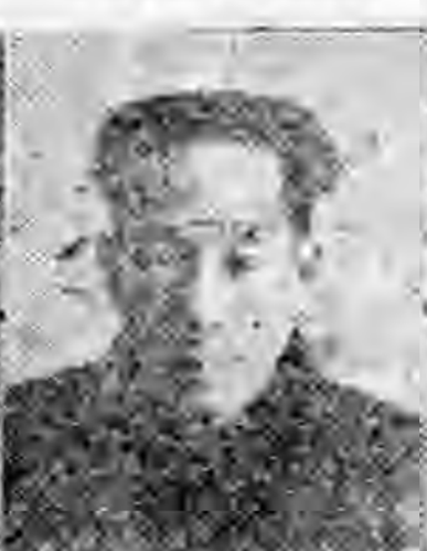
社分滄東廣 員務庶 生先林伯宋