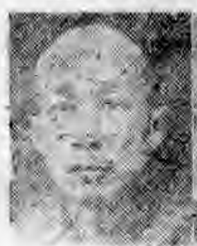
員社社本 江滬北湖 三尊戴