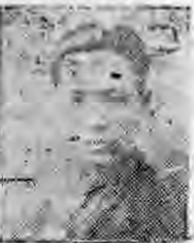
員社社本 遊仙建福 福慶陳