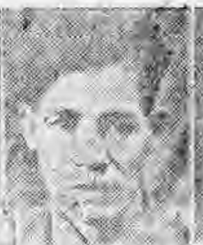
員社社本 岡佛東廣 坤炳鄧