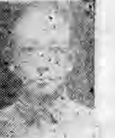
員社社本 南汝南河 英世楊