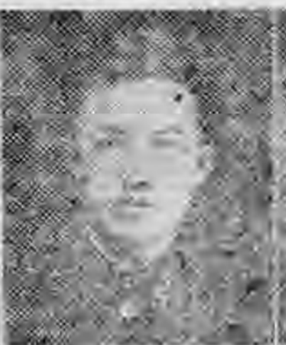
員社社本 杭上建福 村玉袁