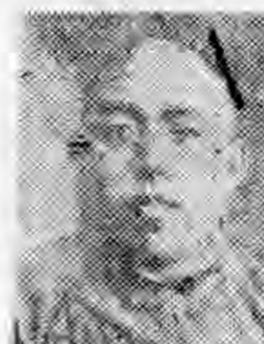
員社社本 師鄧南河 賓濟丁