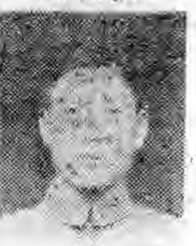
員社社本 安泰肅甘 極映注