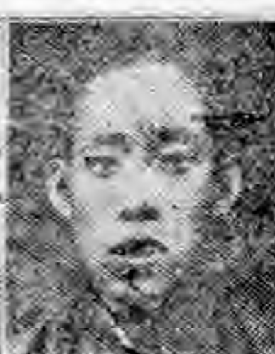
員社社本 慶延省察 普玉陳