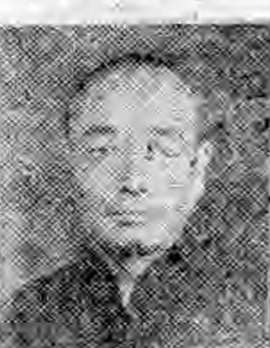
社分山唐北河 事幹傳宣 生先域廣曹