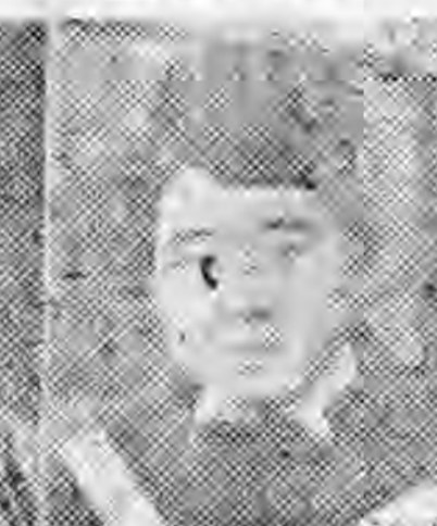
社分山唐北河 任主務總 士女資文王