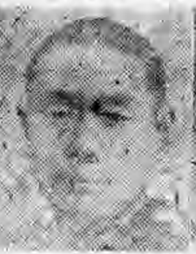
當兩肅甘 長社分 生先鉢張