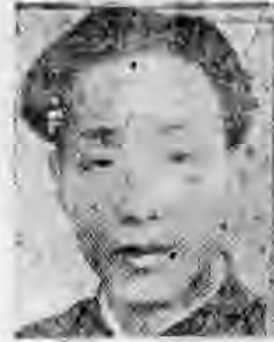
員社社本 進武蘇江 勤宏王