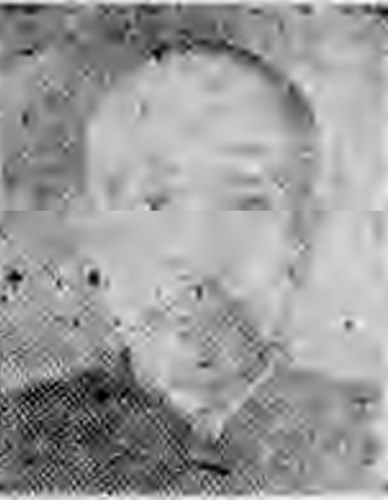
員社社本 慶重川四 三聯陳