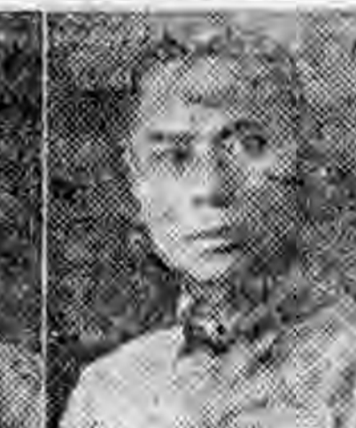
員社社本 雄南東廣 湖鏡金