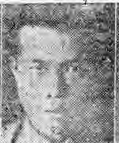
社分沈洽東廣 任主傳宣 生先龍天賴