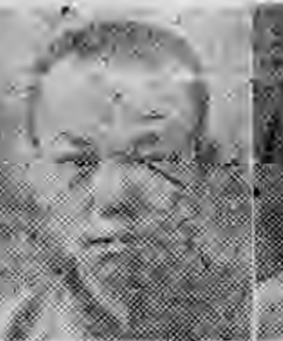
員社社本 陽資西廣 階映楊