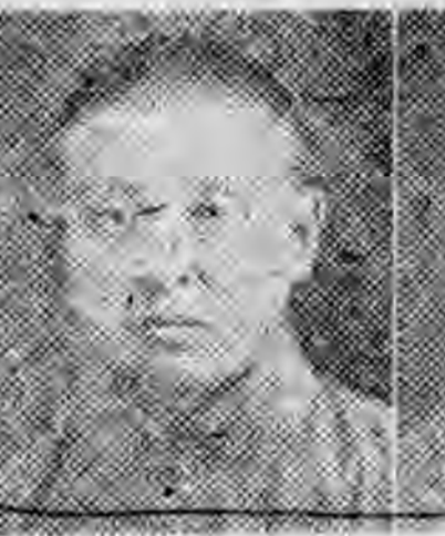
員社社本 虞上江浙 仙橋李