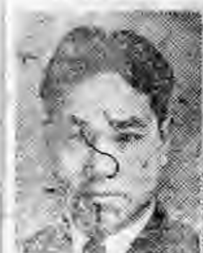
員社社本 定正北河 年鶴袁