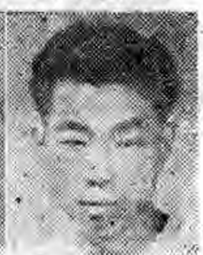
社分店徐北河 任主述撰 生先潤德李