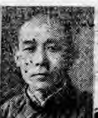
員社社本 城舒徽安 三澤宋