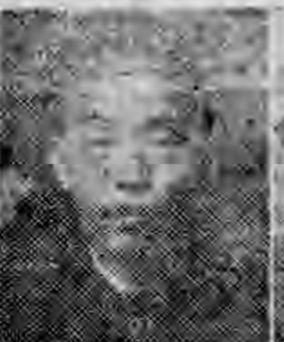
員社社本 春永建福 光國對