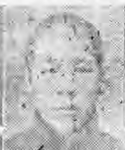
社分山唐北河 任主副究研 生先廣迺張