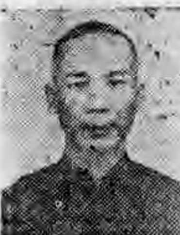
社分沈洽東廣 任主導指 生先文晉羅