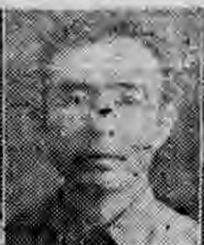
員社社本 溪安建福 在憲林