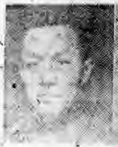
社分慈鄞江浙 任主行推 生先祥伯凌