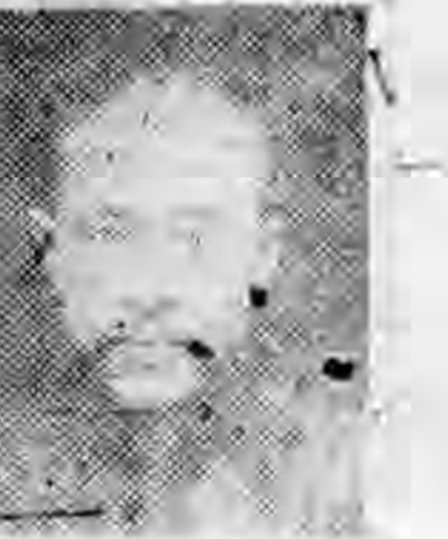
社分義孝西山 長社分 生先茂德吳