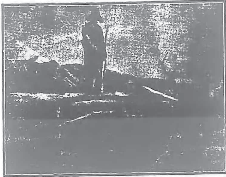
在黑山白水間的英勇義勇軍崗哨。

人。飛機約有三百架至四百架，唐克車有一百五十輛至一百八十輛，重炮約有三十至四十挺。