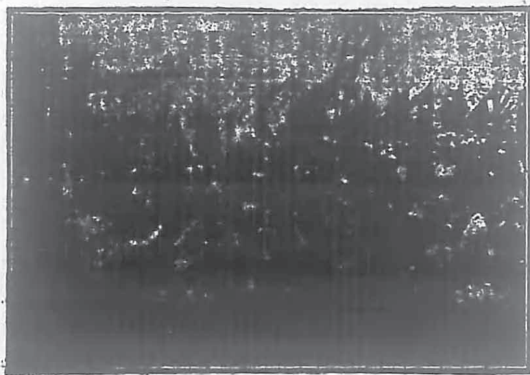
日本民衆反戰反法西斯的大示威

估計到東北抗日民族革命運動本身之優點和弱點；就正像中國共產黨東北黨組織自己所指出的任務：在目前必需不失去一分鐘和一點鐘的時機，去真正在各地方不分黨派、信仰、隊頭、民族和籍貫等等之不同，把各地所有一切抗日武裝隊伍都團結在各地抗日聯軍的周圍，並