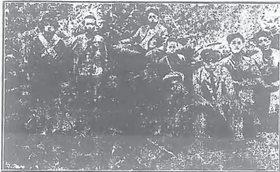
東北抗日聯軍第四軍野外政治訓練談話會