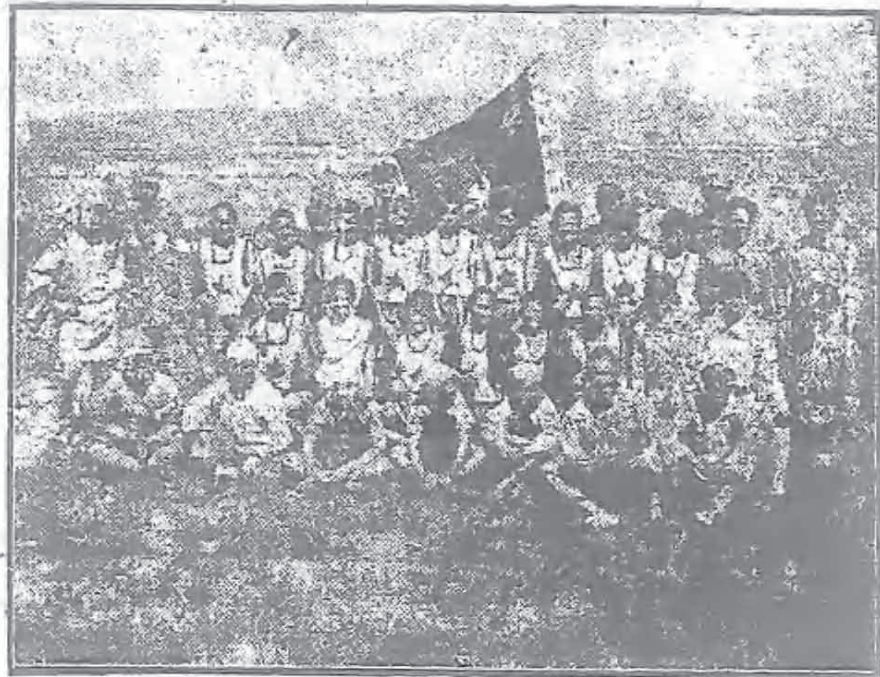
第八路軍戰士劇社

擊戰爭，使敵人頭也受襲尾又受擊，要點被困，交通斷絕，這樣確實制其死命！所謂「單者易折」，「衆者難摧」就是這道理。就拿一件很平凡的事來說吧！譬如一個黃蜂力量比不起一個人的本領，但人給三五個黃蜂來襲的時候，還可以抵當得過，如果同時有百千的黃蜂由四方八面擁來的話，那就應付不及，只好抱頭鼠竄以「逃之夭夭」爲得計。我們說運用民衆廣泛的游擊戰爭，有足以摧毀敵人的精良部隊偉大力量的道理也即是這樣。