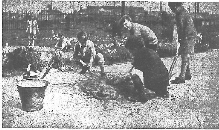
池 造 (五)