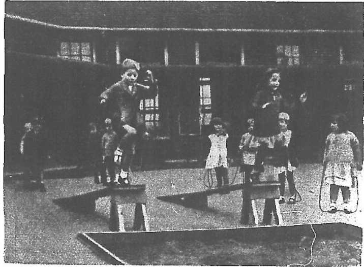
戲 遊 (三)