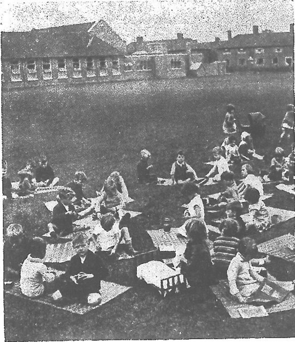
動 活 天 露 (二)