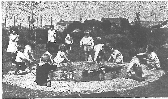
池 造 (八)