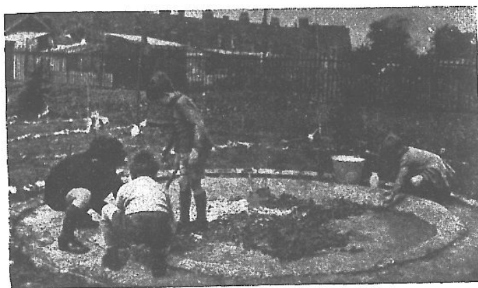
池 造 (六)