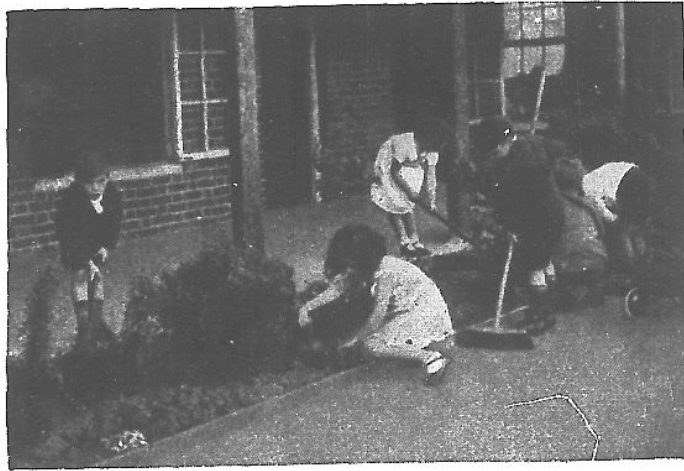
花 種 (四)