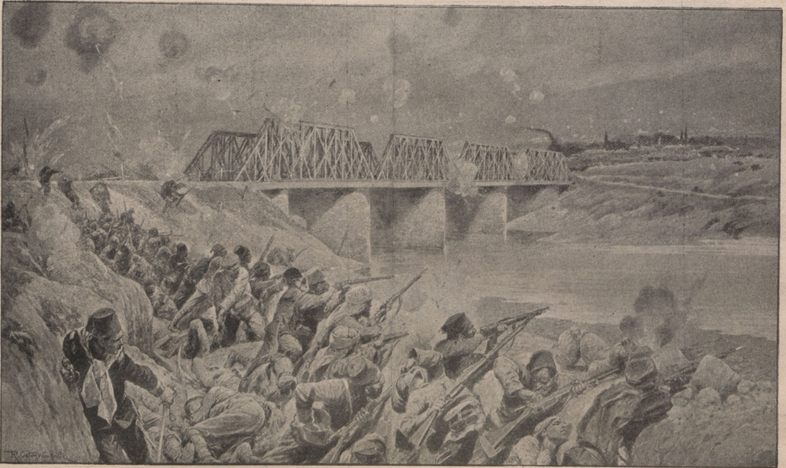
Бой у желъзнодорожнаго моста на рѣкѣ Эргене подъ Люле-Бургасомъ.