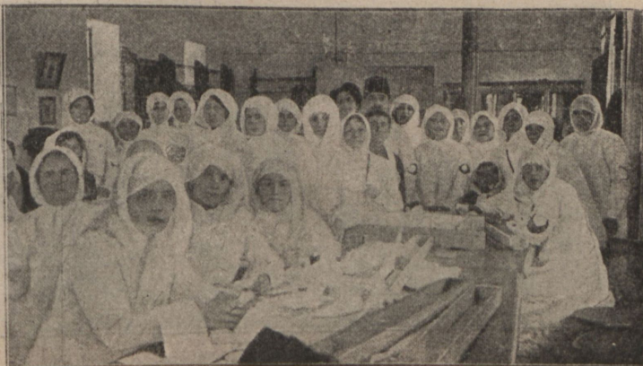
Турецкія дамы „Краснаго Креста“ въ госпиталь.