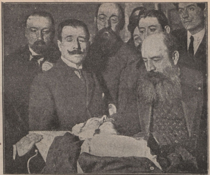
Убийца Каналехаса Мануэль Саратти.