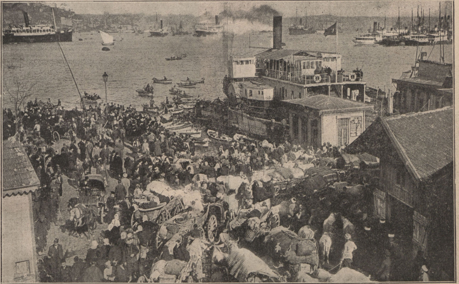
Турецкіе бѣглецы на Босфорской набережной.