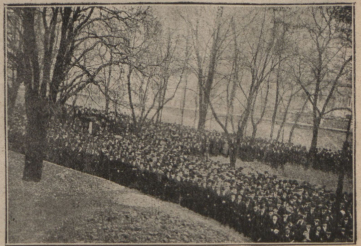
Манifestаціи противъ войны чехо-словенскихъ с.-демократовъ въ Прагѣ.