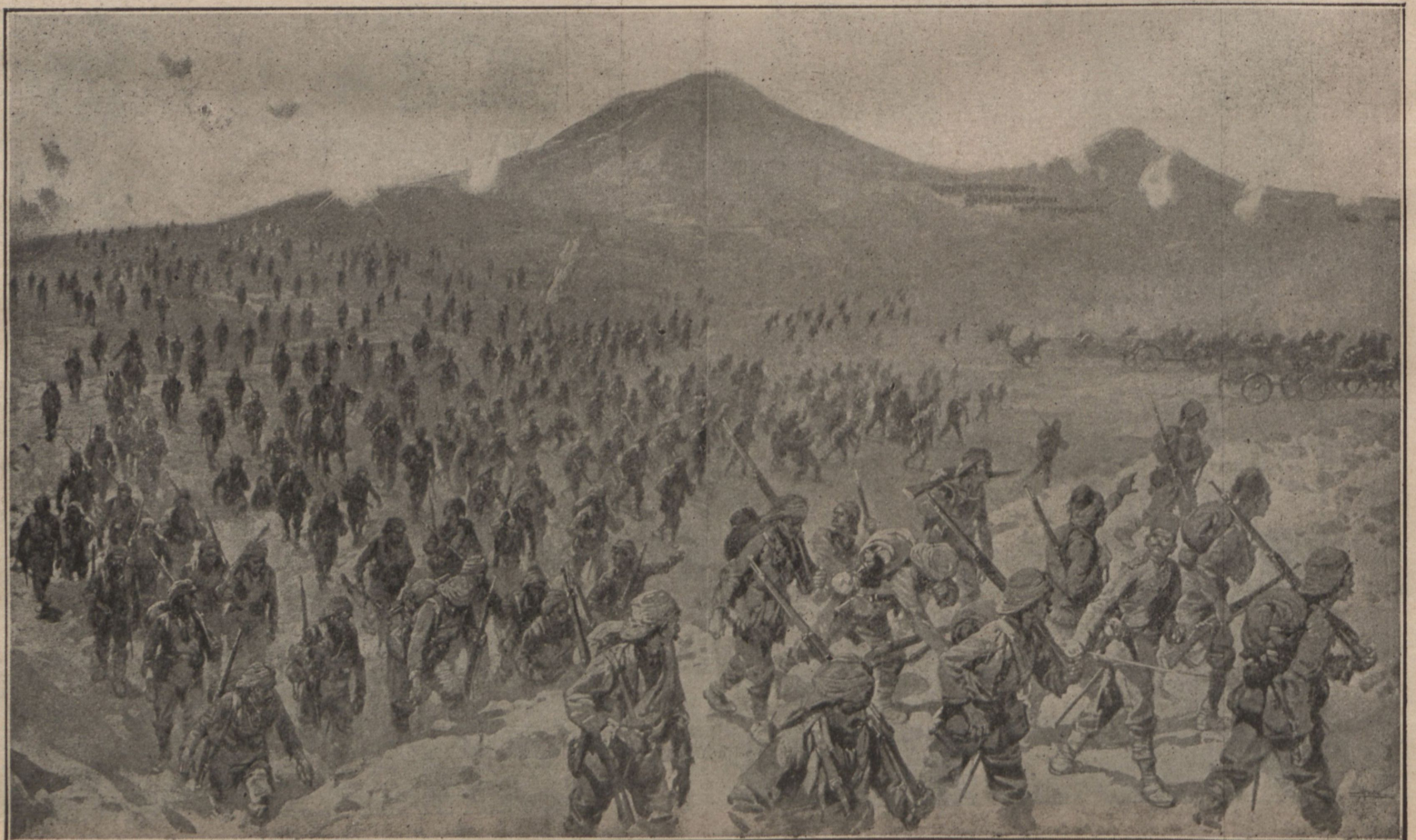
Отступленіе турецкихъ войскъ подъ шрапнельнымъ огнемъ при Люле-Бургасѣ,