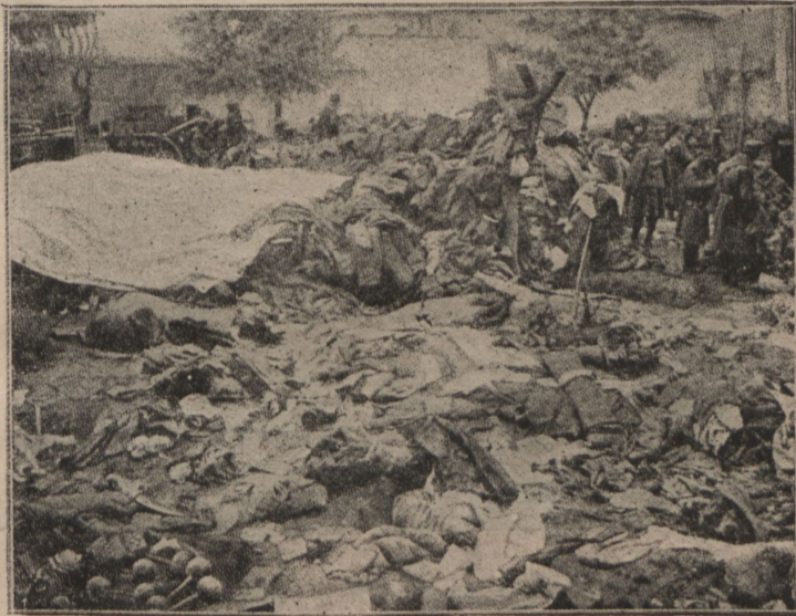
Арсеналь въ Ускюбѣ послѣ бѣгства побѣжденныхъ