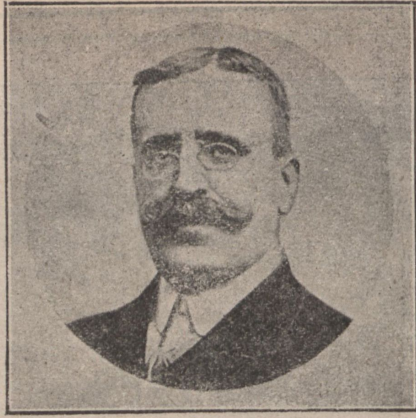
Испанскій премьеръ Каналехасъ, убитый анархистомъ.