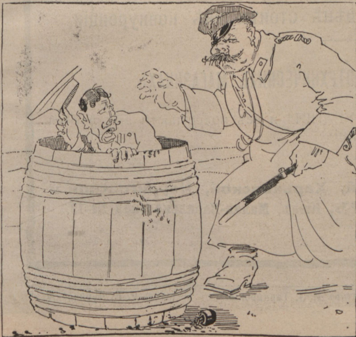
Союзники: Господинъ городской не трогайте меня—испачкаетесь!..