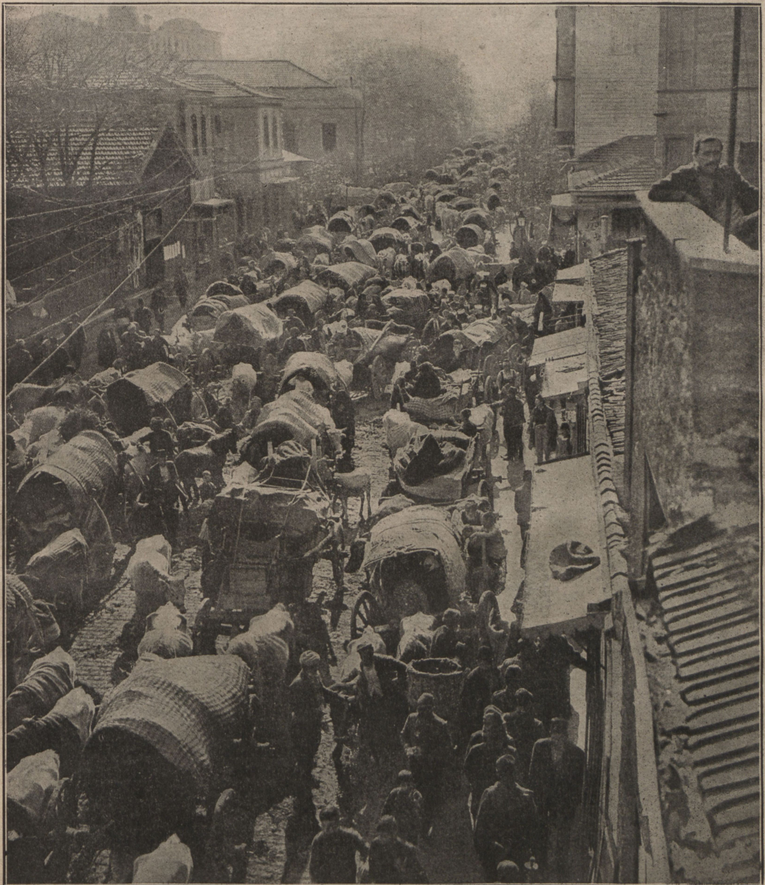
Турецкіе крестьяне бѣглецы, заполняющіе улицы приморскихъ городовъ.