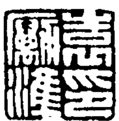
表 勵 學