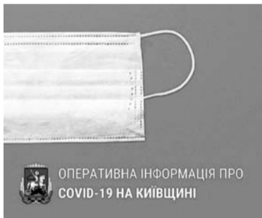
ОПЕРАТИВНА ІНФОРМАЦІЯ ПРО COVID-19 НА КИЇВЩИНІ

За даними Київського обласного лабораторного центру, в області 10 вересня 2020 року на 10:00 офіційно підтверджено 6278 випадків захворювання на коронавірус (з них – 542 діти)