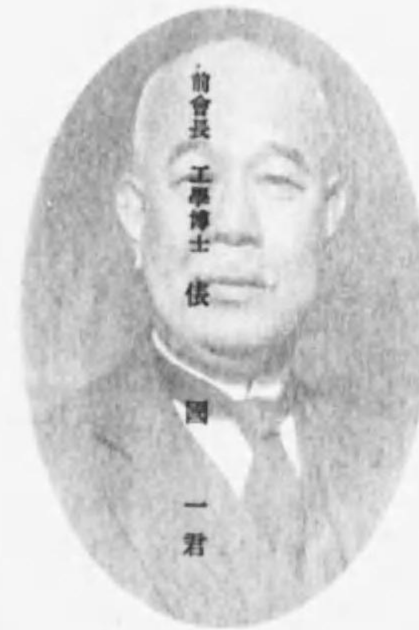
前會長 工學博士 依 國 一 君