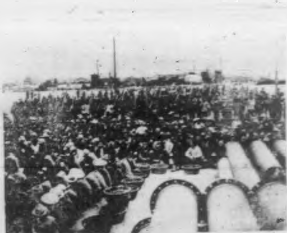
↑在四號碼頭填海的大人工群

十一月十五日止，任用工人最高額每日達四千九百人，共用十萬零八千一百六十三工，支出領隊人員及人工資麵粉共五〇五五袋又三十六斤。