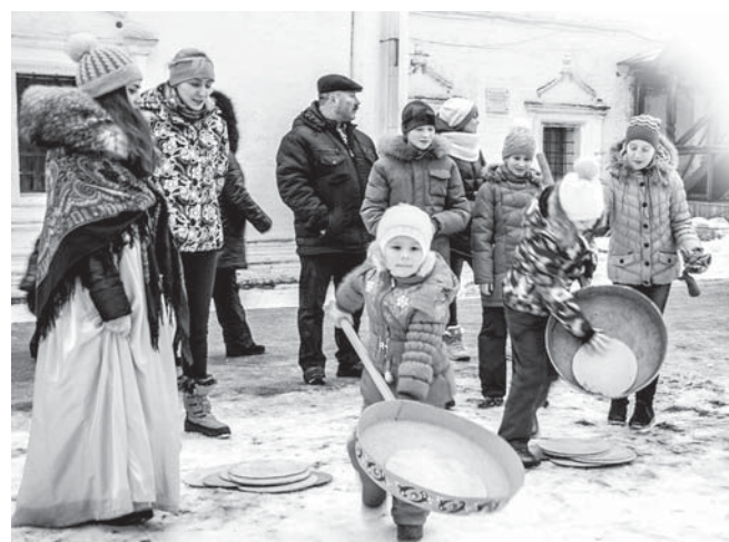
А ну-ка, кто больше и быстрее напечет блинов?

Страницу подготовил Алексей КОВАЛЕВ.