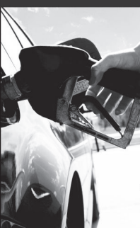
ГРАФИК СУТОЧНЫЙ 1/2