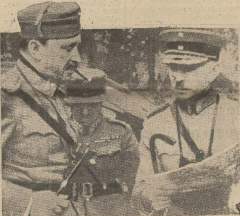
Mareşal Manterhaym ordu erkânile görüşürken (Yazısı 5 inçide)

Finlandiya istiklâlinin 22 nci yıldönümü dün kutlandı