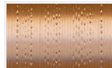
Поверхня фоновалика № 37. Можна побачити форму звукової доріжки.

Колекція фонографічних валиків була призбрана на початку XX століття в рамках акції української інтелігенції, зініційованої задля збереження мистецтва традиційного кобзарства та лірництва. Першими призвідцями та виконавцями цього історичного починання виступили Гнат Хоткевич, Опанас Сластьон та Олександр Бородай, які в силу різних причин справу до кінця так і не довели [1] . Згодом ідею підхопили Леся Українка та Климент Квітка. За сприяння та матеріальної підтримки подружжя (і насамперед Лесі Українки), влітку 1908 року Філарет Колесса здійснив фольклористичну експедицію у Наддніпрянську Україну, записавши на Миргородщині репертуар шести народних виконавців. У роботі йому допомагав О.Сластьон, який після повернення галицького фольклориста до Львова, впродовж 1908—1910 років продовжив фонографування співу та гри кобзарів і лірників. До рекордування кобзарсько-лірницького репертуару восени 1908 року долучилися також Леся Українка та Климент Квітка [2] . Усі записані валики для транскрибування зафіксованих на них творів та їх наступної публікації були передані Ф.Колесі до Львова. Незадовго галицький фольклорист роботу з підготовки матеріалу до друку успішно завершив і два томи "Мелодій українських народних дум"