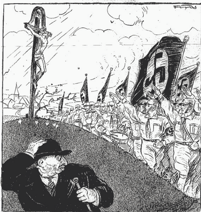
Ілюстрація з нацистської пропагандистської газети «Der Stürmer».

ганської, Донецької, Херсонської та Запорізької областей, м. Маріуполь). При цьому було замов-