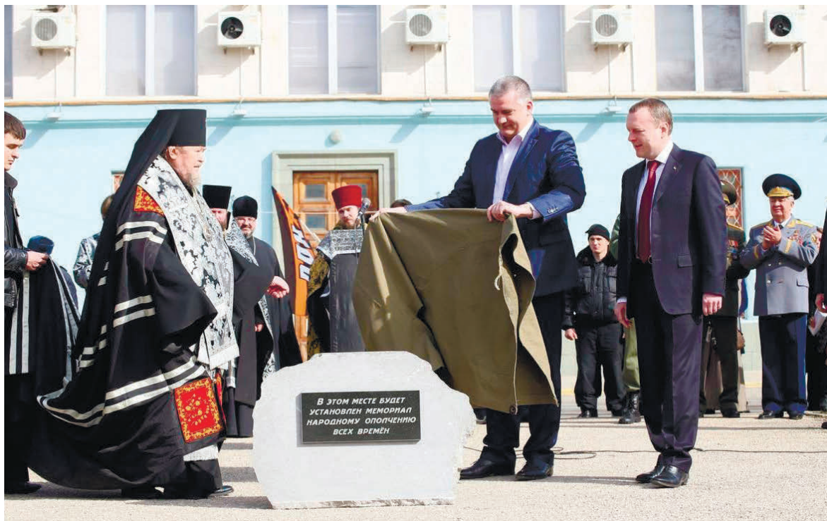
«Глава» Криму сергій аксьонов та очільник Сімферопольської єпархії УПЦ (МП) митрополит Лазар (Швець) на закладенні каменя майбутнього пам'ятника «народному ополченню усіх часів».

Також Халюта фактично назвав російських військових уособленням християнства, запевнив у їхньому високому рівні людяності та зазначив, що церква підтримує їх та опікується ними, зокрема під час перебування на території України. Окрім того, він розповів, що священнослужителі привозять гуманітарну допомогу на окуповані території (частини Лу-