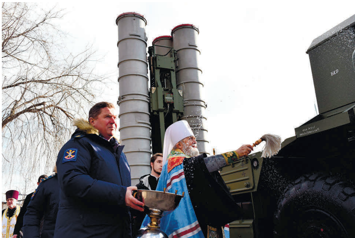
Освячення у Криму російського зенітно-ракетного комплексу С-400 «Тріумф».

Зовсім не складно зрозуміти, що співпраця з державою, яка веде агресивну загарбницьку війну проти України, публічна підтримка її армії (яка скоює