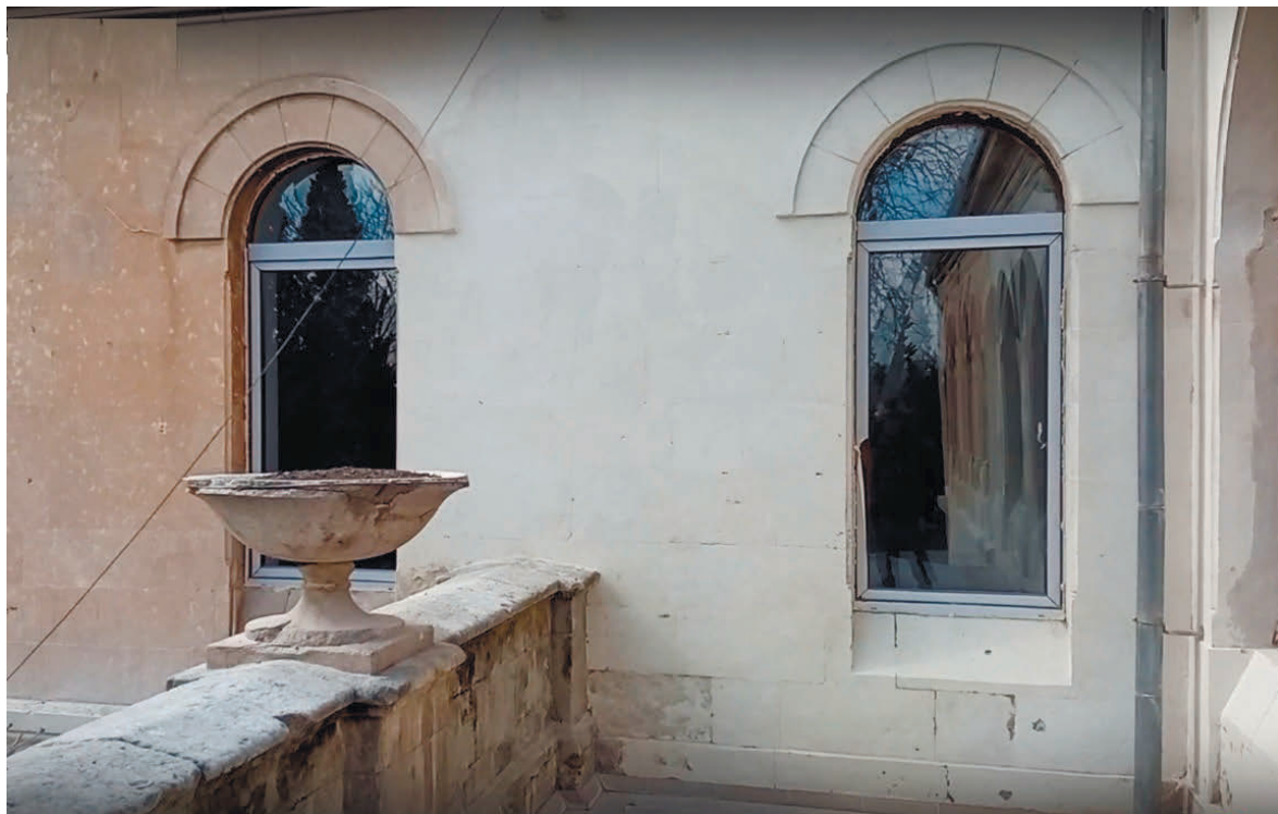
Металопластикові вікна в «архієрейському будинку»

бруду та нальоту, ремонт печей і димарів, вікон бібліотеки.