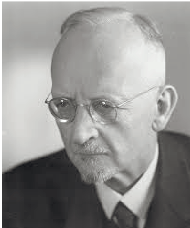
Герхард Кіттель, німецький лютеранський теолог, активний прибічник нацистів і відкритий антисеміт.

Не цурався псевдорелігійних аргументів і один з провідних світських пропагандистів рейху – головний редактор газети «Der Stürmer» Юліус Штрайхер, засуджений Нюрнберзьким трибуналом до страти. Цікавим фактом є те, що суд не знайшов жодного випадку вчинення насильства щодо євреїв Штрайхером особисто, але відзначив