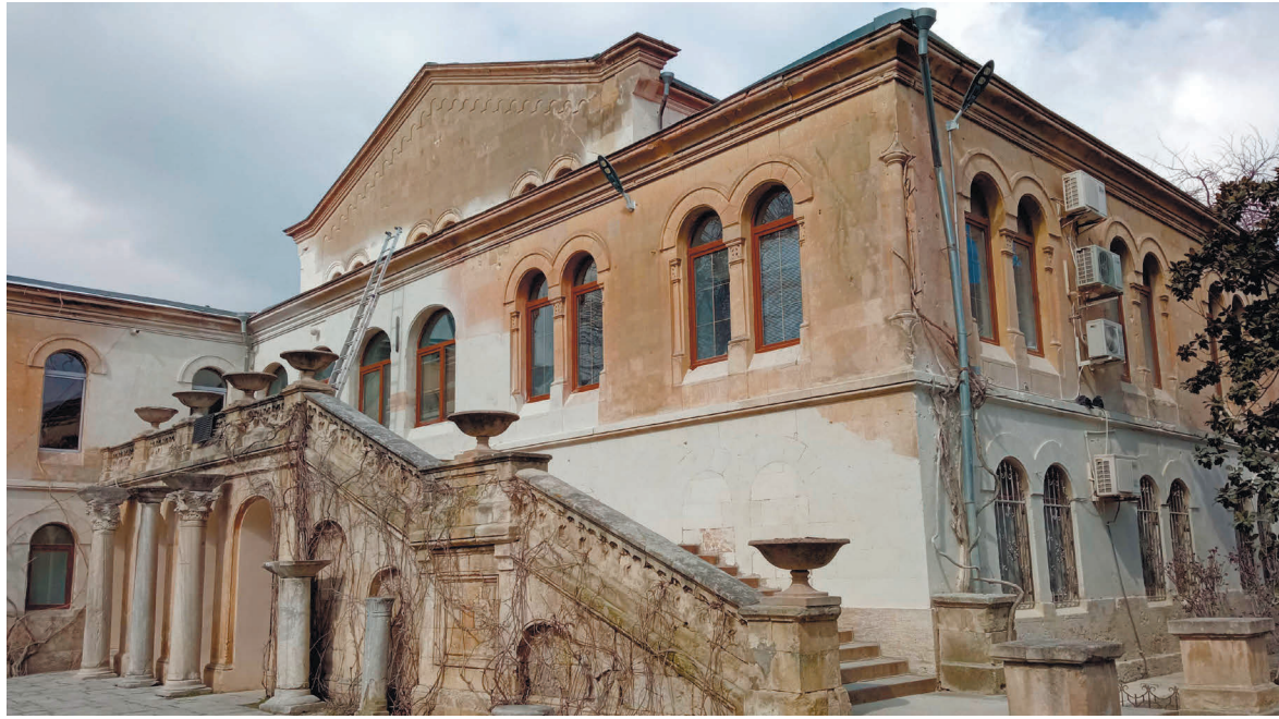
«Архієрейський будинок», де розташовувався настоятельський корпус Херсонеського монастиря

Будівля, про яку йдеться, непересічна. Її було споруджено на початку 60-х років XIX століття, і наразі вона відома як «архієрейський будинок», оскільки в ній розташовувався настоятельський корпус Херсонеського монастиря. Першого ремонту будівля зазнала у 1899 році. Після більшовицької окупації Криму, в 1921 році, у споруді облаштували будинок для осіб з інвалідністю, а в 1924 році її передали на баланс археологічного музею. У 1925 році було проведено терміновий капітальний ремонт, під час якого було відновлено дах, вікна та двері, а також на другому поверсі облаштовано експозицію музею Візантійської історії Херсонеса Таврійського, бібліотеку та адміністративні кабінети. У 1928 році відбулися ремонт даху, встановлення нових шибок, білення стін, у 1933 році – черговий ремонт даху, а в 1938 році – капітальний ремонт фасаду з очищенням стін від