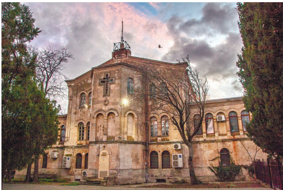
Візантійський двірник заповідника «Херсонес Таврійський»

Що ж стосується заміни унікальних дерев'яних шибок «архієрейського будинку» на новітні пластикові склопакети низької якості – Горелов згадав, що це вже не перший випадок з історичною будівлею в Севастополі після «російської весни»: так, у Петропавлівському соборі варварська заміна вікон докорінно змінила сприйняття старовинної споруди. Слід зазначити, що подібні підходи