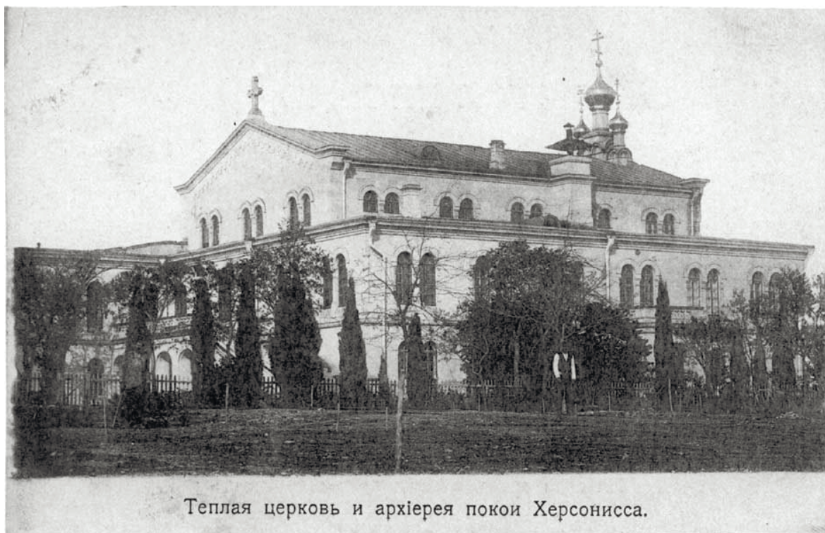
Теплая церковь и архієрея покои Херсонисса.

до «реконструкції» історичних споруд є для окупованого міста звичним явищем: наприклад, у 2017 році біля пам'ятника адміралові Сенявіну «негарний сіренький» (тобто зі старовинним шаром) парапет із кримбальського каменю замінили на «гарний біленький», який незабаром почав кришитися, внаслідок чого виникла необхідність вже у його заміні.