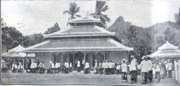
အစိုးရက အစွမ်းထက်စွာ ကြိုးပမ်းဆောင်ရွက်ခဲ့ပြီး နိုင်ငံတော်အတွက် အကျိုးရှိစေရန် ကြိုးပမ်းဆောင်ရွက်ခဲ့သည်။