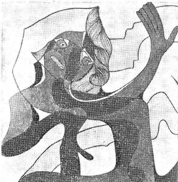
NELLY MARTINS DETALHE