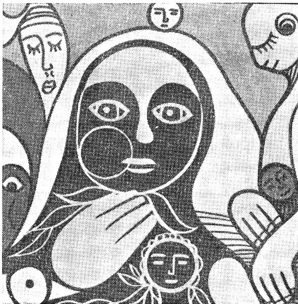
HILTON SILVA DETALHE