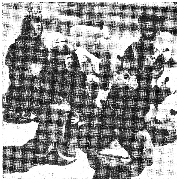
CERÂMICA DE S. GONÇALO PRESÉPIO