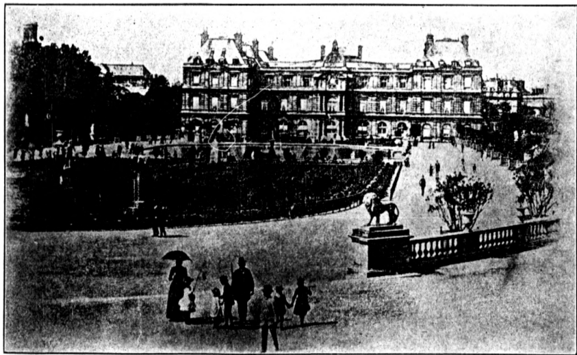
法 國 上 議 院 之 外 觀