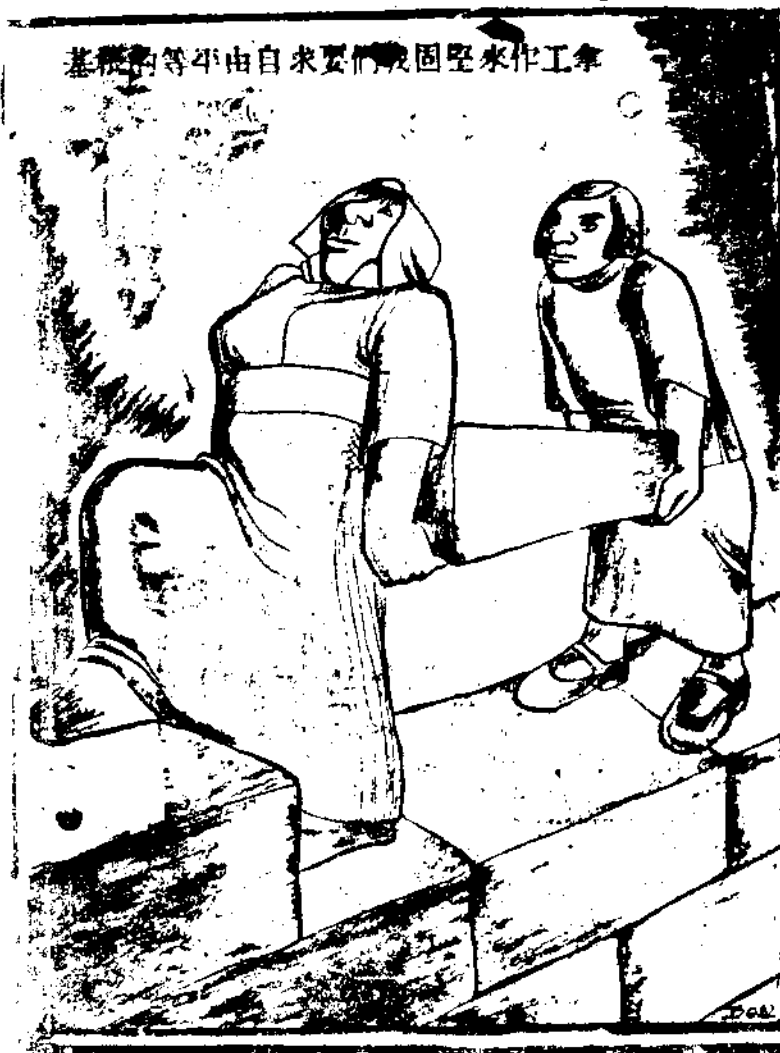
基務的等平由自求要們戰固堅來作工拿