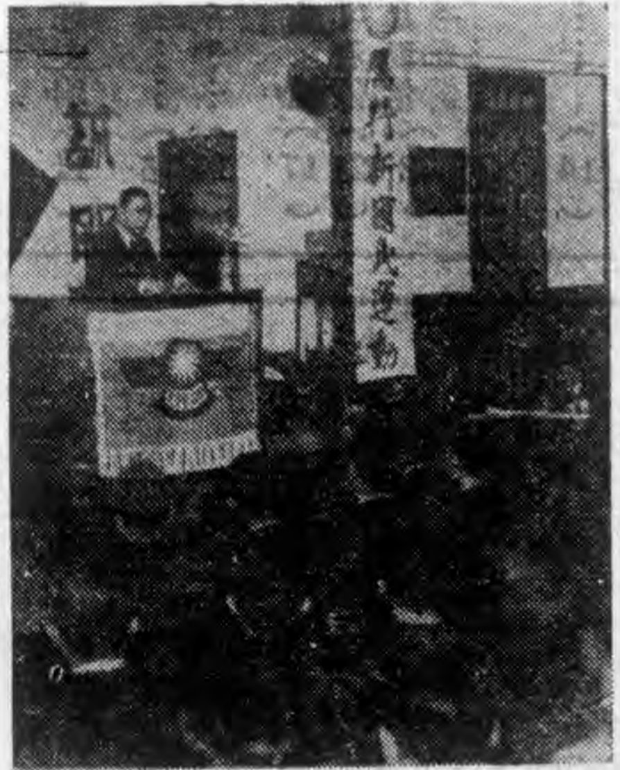
中宣團特訓會開幕 主席訓話

中宣 講習會之籌備 團特 各組研究綱領 訓講 各組研究者及指導者 習會 各組研究成績總報告 專頁 講習會開會經過情形 ▲地方會議與後方建設 ▲英內閣之改組