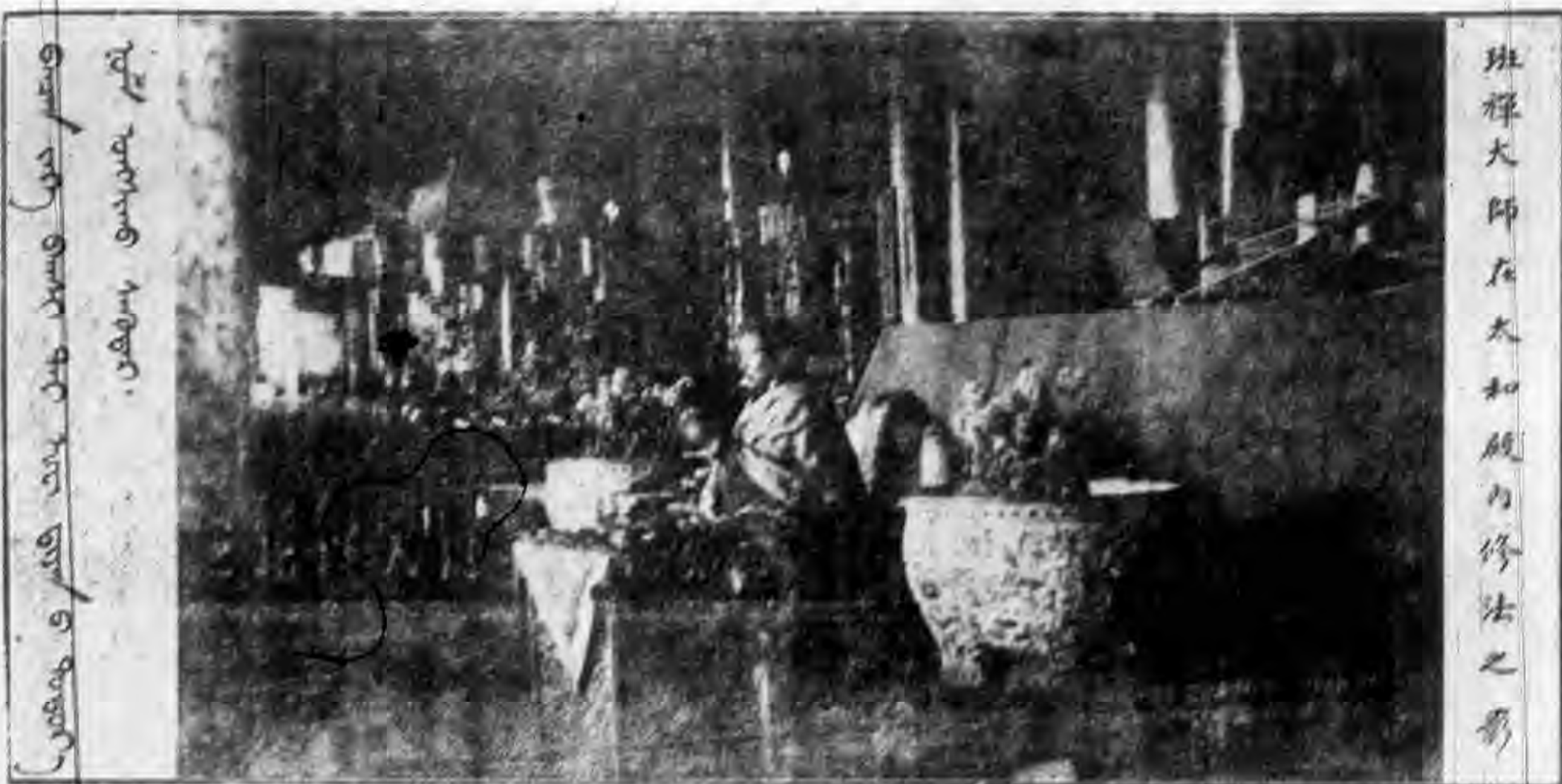
班禪大師在太和殿內修法之景

國聞社云，時輪法會息災救劫道場，二十一日上午六時半起，在太和殿開幕，平津軍政要人在野名流，及各界民衆，蒙古王公庶民，喇嘛僧徒到會參加者，達十萬人