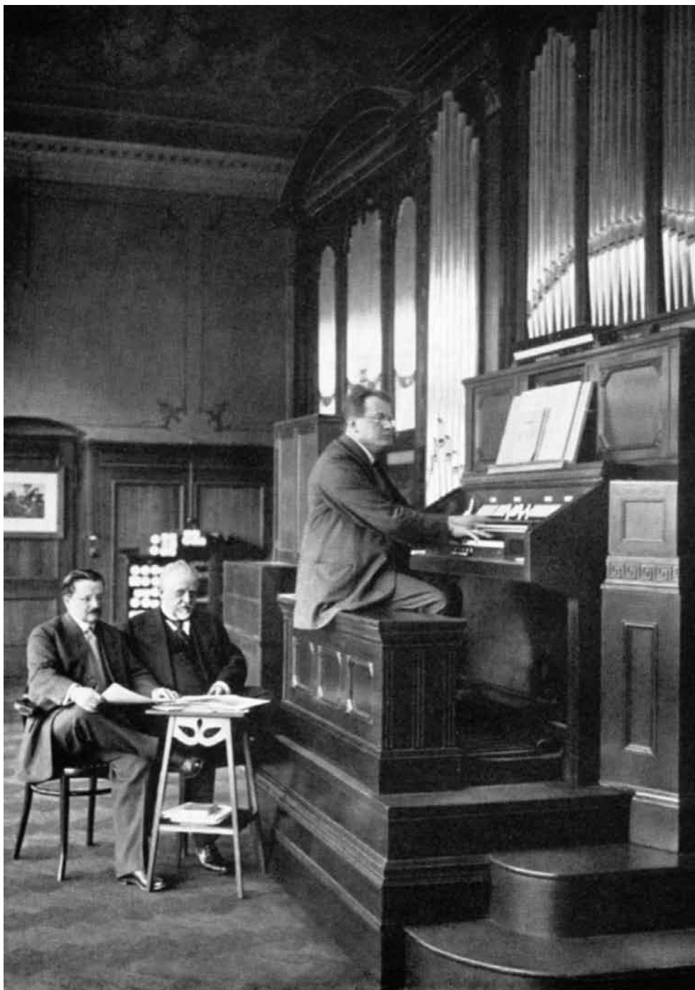
Max Reger tijdens een opnamesessie met het 'Welte-Philharmonie orgel' (1913)

Over het leven van Reger is veel geschreven, en niet altijd even positief. Reeds tijdens zijn leven stapelden de vooroordelen tegenover zijn muziek zich op: Reger, de epigoon van Bach en Brahms; een Brahms voor armelui; de reactionaire ambachtsman zonder een greintje persoonlijkheid enz. Hij was een excentrieke componist en ook heel erg begeistert door Bach. Een befaamd citaat van hem luidt: "Bach ist Anfang und Ende aller Musik" [Bach is het begin en het einde van alle muziek] In Bach bewonderde hij vooral het onuitputtelijke contrapunt, dat door Bach in de eerste helft van de achttiende eeuw tot een uitiem hoogtepunt was ontwikkeld.