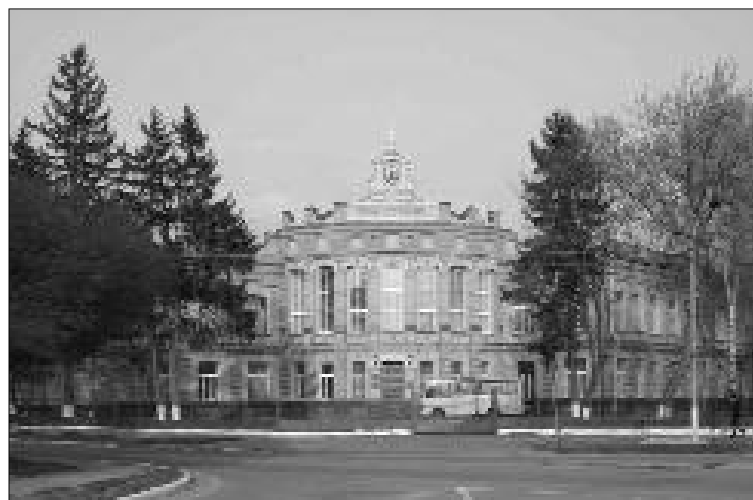
Новгород-Сіверська гімназія тривалий час була центром освіти колишньої Чернігівської губернії

Зі стін гімназії вийшли письменник, археолог, правник М. В. Шугуров (1843—1901); педагог, свого часу попечитель Київського навчального округу, знайомий Т. Г. Шевченка П. О. Антонович (1812—1883), літературознавець Д. П. Сильчевський (1851—1919), активний діяч губернського земства, історик-публіцист Ф. М. Уманець (1841—1918); викладач, фольклорист П. О. Чуйкевич (1818—1874), учений-бджолар О. І. Покорський-Журавко (1813—1874); один із відомих меценатів Києва, лісопромисловець, суспільний діяч