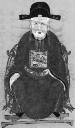
一世祖宗永嘉縣諱溫解字致和公遺像