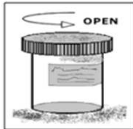
2. 무균용기 사용