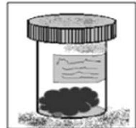
4. 완전 밀봉 (4°C 유지)