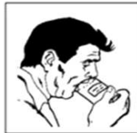
3. 기침유도하여 가래 채취