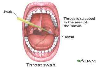
<구인두도말물 채취 방법>