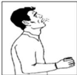
1. 구강 세척

○ 멸균용기(가래통 등)에 타액 등이 포함되지 않도록 기침을 유도하여 채취