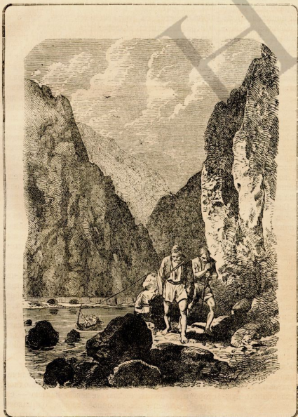
Траншея дорога въ Желѣзныхъ воротахъ, на Дунаѣ.

Принять на себя, вмѣсто Чехіи, извѣстную часть долга всего государства, или облагать ее податями, или какою бы то ни было способомъ наложить на нее обязательства не можетъ никакъ,