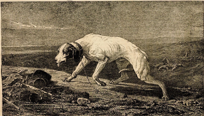
«Собака офицера», картина Делана.

въ журналѣ «Гфассе»: «Власть опирается прежде всего на мѣшья, выраженные палатами, этимъ единственнымъ, законнымъ органомъ народныхъ чувствъ». Въ Англии можно бы было это сказать, но во Франціи—это одиѣ пустяги. Большинство законодательнаго собранія состоитъ изъ официальныхъ кандидатовъ, преданныхъ глазѣмъ правительства, но не пользующихся довѣріемъ страны. Мексиканская эспедиція доказала, что между народомъ и официальными представителями нѣтъ единства чувствъ. Даже армія недовольна была этимъ походомъ, одобреннымъ, однако, большинствомъ французскихъ депутатовъ. Газета «Гфассе» не опровергаетъ, что войско хочетъ войны, потому что это желаніе очевидно, но не соглашается, что духъ арміи можетъ имѣть рѣшительное вліяніе на волю Луи-Наполеона. Но онъ самъ желаетъ ли мира? Кто можетъ знать его мысли? Редакторъ «Гфассе» говоритъ еще, что французская армія состоитъ изъ самыхъ благородныхъ, справедливыхъ и преданныхъ представителей національной политики. Все это одинъ слова. Вся Европа знаетъ, что это не представители, а поворные слуги прави-