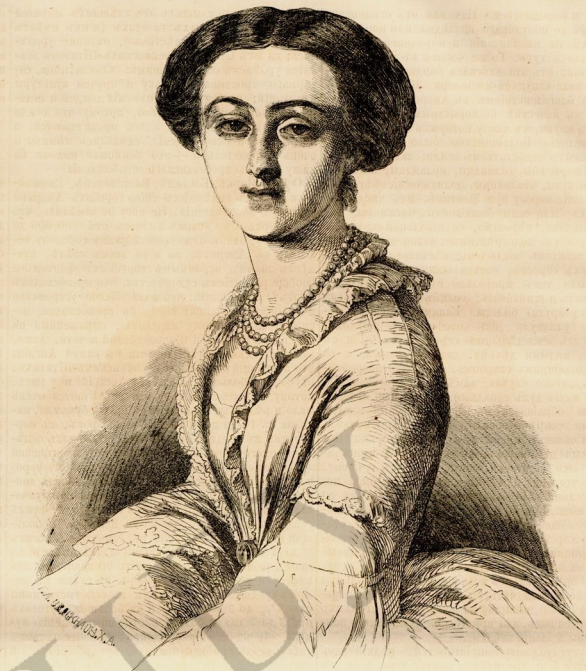
Ея Императорское Высочество Валыка Княгиня Ольга Феодорова.

Изъ Гамбурга я уже сообщалъ вамъ, въ крайнюю перепись, о своемъ поѣздѣ по Европѣ. Отъ Одессы, съ половиною июня, меня непрерывно сопровождалъ дождь и ненастья чуть не ежедневно, въ отрадѣ сельскаго человѣка и къ досадѣ вождя; тѣ же невгоды сопровождали меня при перѣздѣ черезъ Атлантическій океанъ, съ тѣмъ различіемъ, что на водномъ пути оказались онѣ еще рѣзче, неперіятнѣе и опаснѣе. Условившись съ транспортною заатлантическою компаніею Гиршмана и К о , для перевозки эмигрантовъ и пассажировъ въ Америку, я отправился изъ Гамбурга чрезъ Нѣмецкое море до Лондона и Инвергути, напрасно потративъ нѣсколько дней ожиданія сначала въ Гамбургѣ, потомъ и въ Инвергути, во-