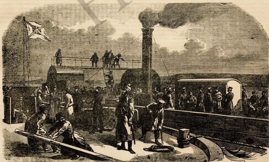
Князь Барятинскій на пароходѣ «Астара».

Получено также свѣдѣніе о затмѣніи отъ инвернаго лейтенанта Гершель, отправленнаго лондонскимъ обществомъ въ Веллгаумъ, на ютъ бейбскаго президентства, для спектроскопическихъ наблюдений. Въ донесѣ сказано: «Множество областей; образовались свѣточ; видны свѣтлыя линіи, но нѣтъ корон; поляризація происходитъ и отъ солнечнаго свѣта». Это, видимо, должно означать, что Гершель видѣлъ спектроскопическую поляризацію, а свѣтлыя линіи доказываютъ присутствіе газообразныхъ тѣлъ. Его наблюденія одинаковы съ Янсеновы. Отъ Германа Фогеля, члена сѣверо-германской экспедиціи, который тоже отправленъ въ Атаку, получены письма, и въ три минуты сняты шесть изображеній затмѣнія. Первое показываетъ темный солнечный дискъ, окруженный рядомъ свѣтлыхъ возвышеній; на другомъ видны свѣтлый роги. Донесеніе Фогеля подтверждено сообщеніемъ комисіи, гдѣ сказано,