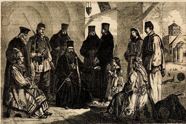
Воскресное утро въ царской лаврѣ Студенца, въ Сербіи.

ческой санкціи, и обязательно, какъ для него, такъ и для его преемниковъ; затѣмъ, съ общаго согласія сейма, оно перенесено на членовъ лотарингской фамиліи, и до нашего времени было всѣмъ разъ возобновляемо присягою, которую давали при своемъ вступленіи на престолъ наши короли. Даже высочайшимъ патентомъ 1-го августа 1804 года, посредствомъ котораго нашъ король Фран-