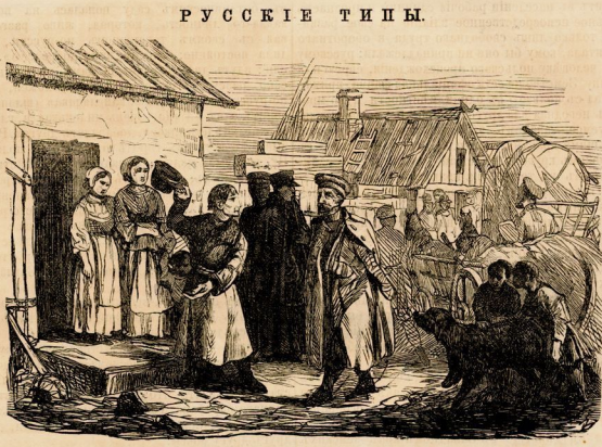
— Ужъ не побрегайте, почтенный хозяинъ, потъ и этого камлата примите! Въдъ за исключаемымъ нумеръ владоръ, особенно за равныхъ солдатомъ.