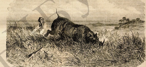
Охота на носорога.

Открывъ свѣтлыя сѣдыя носорога въ зимнемъ лѣсу, они пошли по низку и вскорѣ увидѣли это животное. Сѣдланъ былъ выстрѣлъ, хота и меткій, но не смертельный и носорогъ бросился по его направлению; стрѣлокъ, бившій въ кулакъ, принялъ къ землѣ и разярненное животное проглотило мимо него, къ опушкѣ лѣса, гдѣ былъ вершокъ каптана. Лай; wreже, чѣмъ оны успѣлъ замѣтить несчастья на него носорога, оны были имѣть съ лошадаю животнаго опривнуть на землю. Такъ какъ глаза животнаго способны видѣть только то, чтѣ находится въ недалекомъ разстоянн, то носорогъ оста-