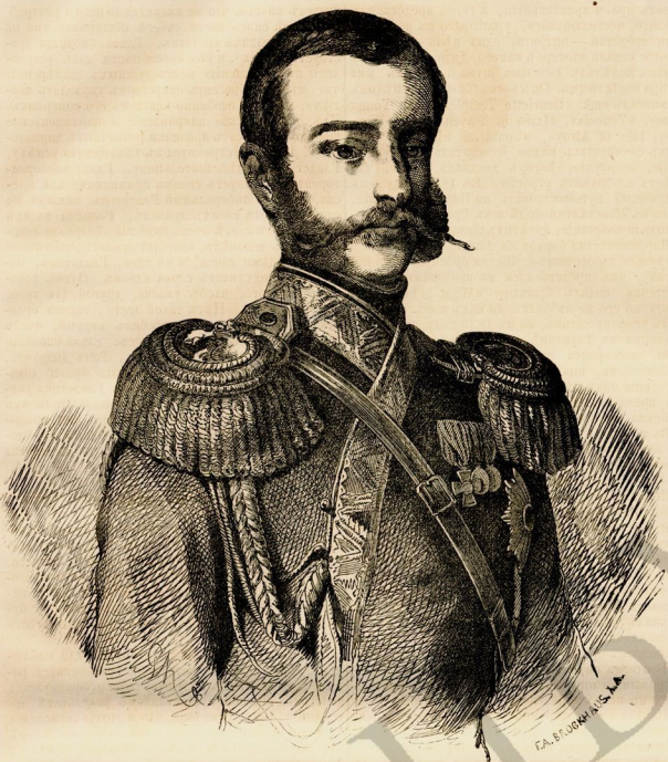
Его Императорское Высочество Великий Князь Михаилъ Николаевичъ.

ходить, отъ менѣ яснаго свѣта сгаравшей химической оболочки.