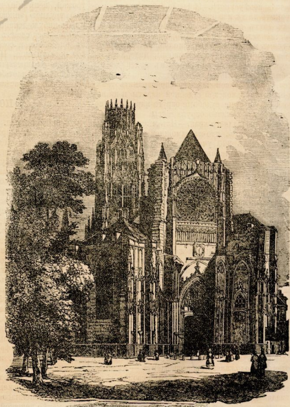
Церковь Свѣт-Уана, въ Руанѣ.