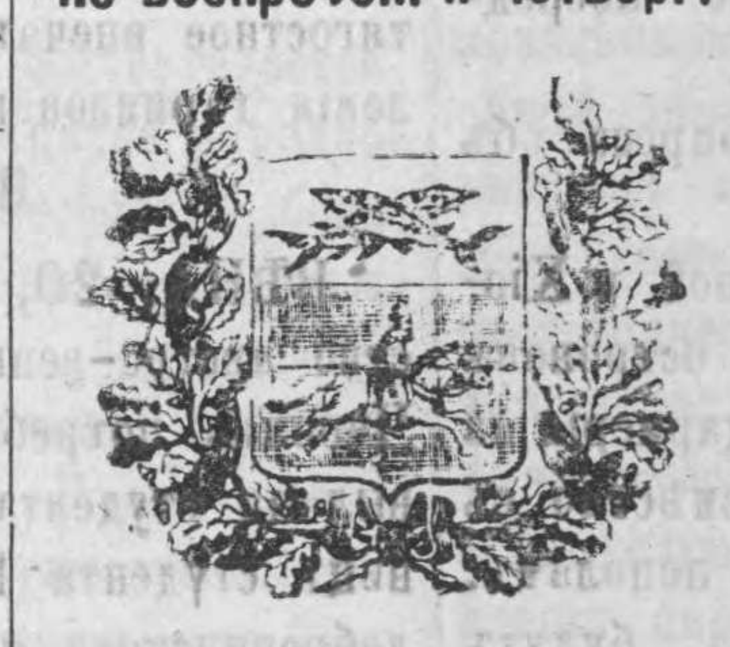
100 №№ ВЬ, годъ.