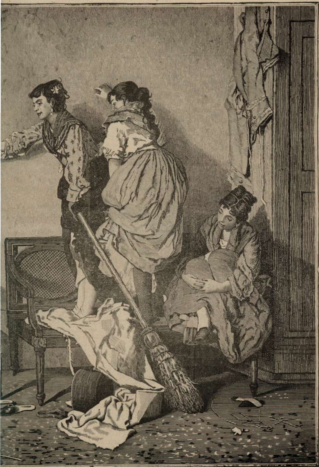
ujmani ai casei.