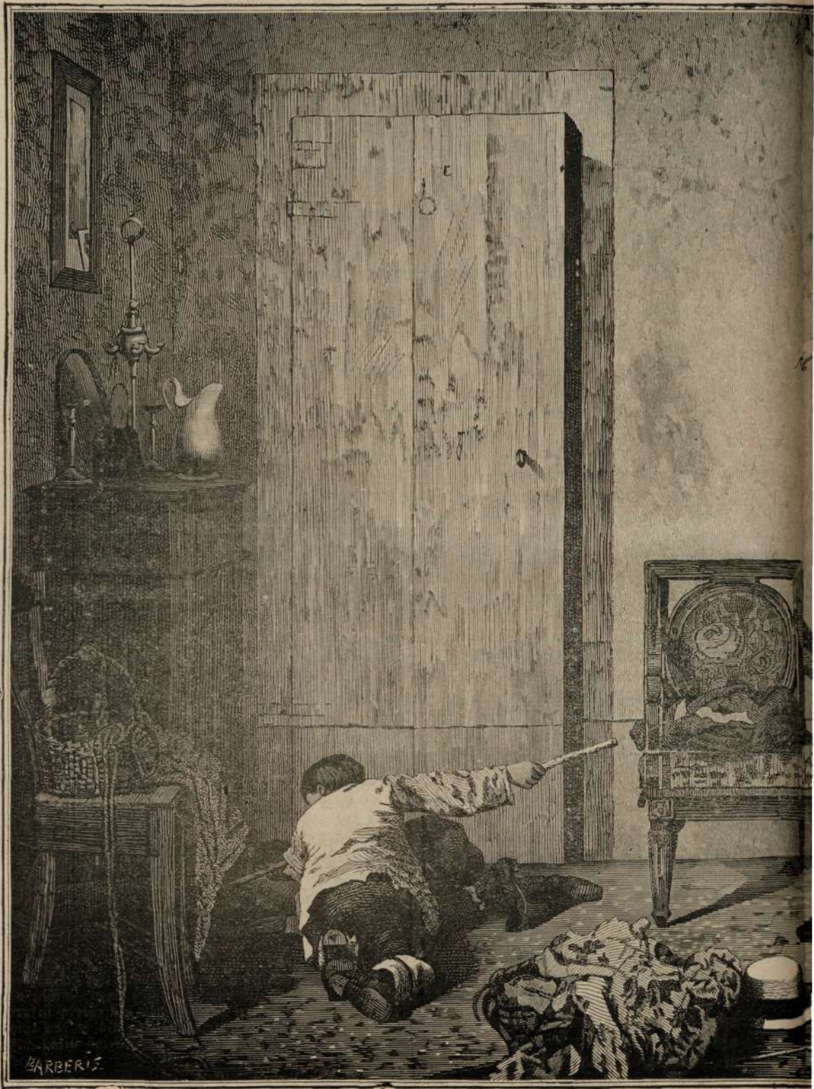
Fric'a de cei mai mi