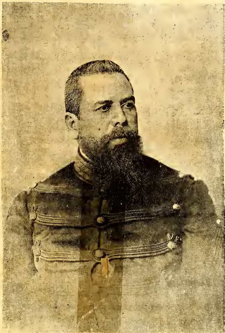
General Joaquín Crespo