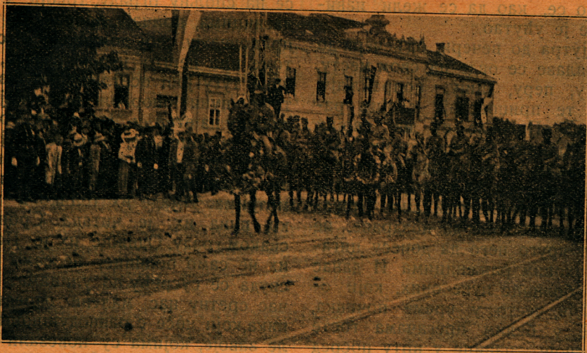
Славље у Београду: