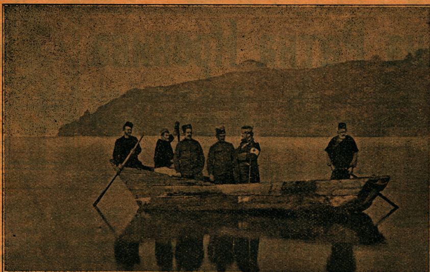
Српски официри на Охридском језеру

кретање падином самога положаја у намери да што пре заузме косу, која се пружала од коте 650 те да тиме осујети обилажење нашег првог крила. У први мах бејаш се збунио мислећи, да нисам добро пренео заповест команданта пука, но доцније видех, да је ово командант батаљона учинио по својој сопственој иницијативи, што је одмах и сам командант пука похвалио.