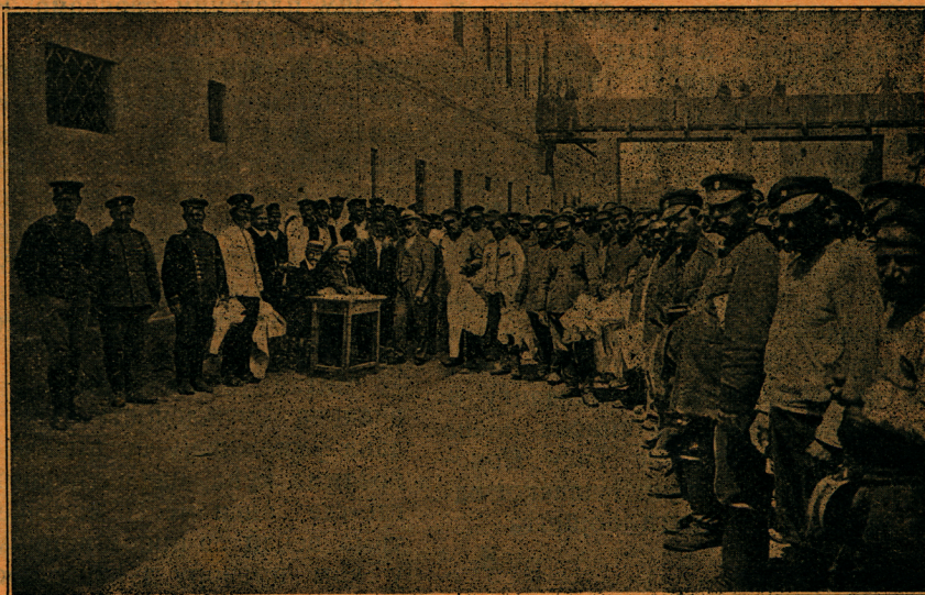
Заробљеним Бугарима раздају у београдској тврђави чисто рубље

Оловком, невешто, руком каквог друга, На крст су имена записана њина: Са те је простоте силна наша туга, У тој је простоти наша величина . . . О светла имена са крстача бели Они што су светом име нам пронели! . . .