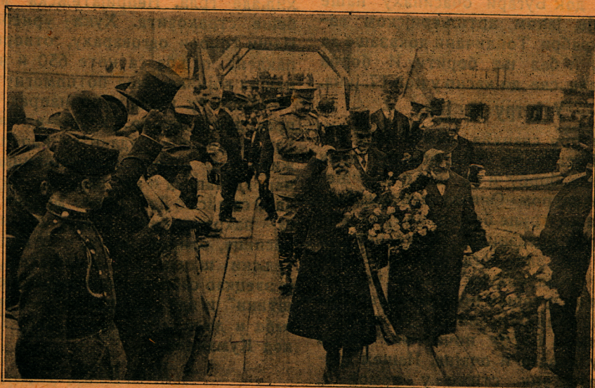
Дочек делегата који се враћају из Букурешта после закључења мира, Пашић, Веницелос и генерал Вукотић

Дошавши на положај и изашавши напред испред свог батаљона, командант је посматрао терен, а затим и не сачекавши нарочиту заповест нареди свом батаљону да продужи