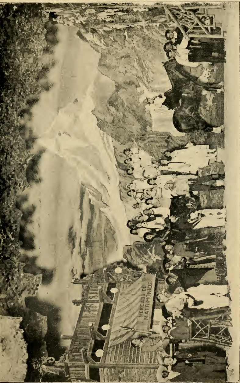
FINAL DEL ACTO PRIMERO