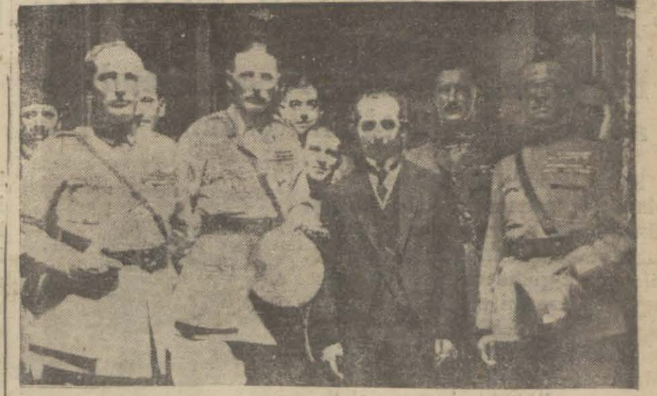
Mudanya mütarekesini akdeden Ismet Paşa ile General Harrington, Şarpt ve Monbelli bir arada