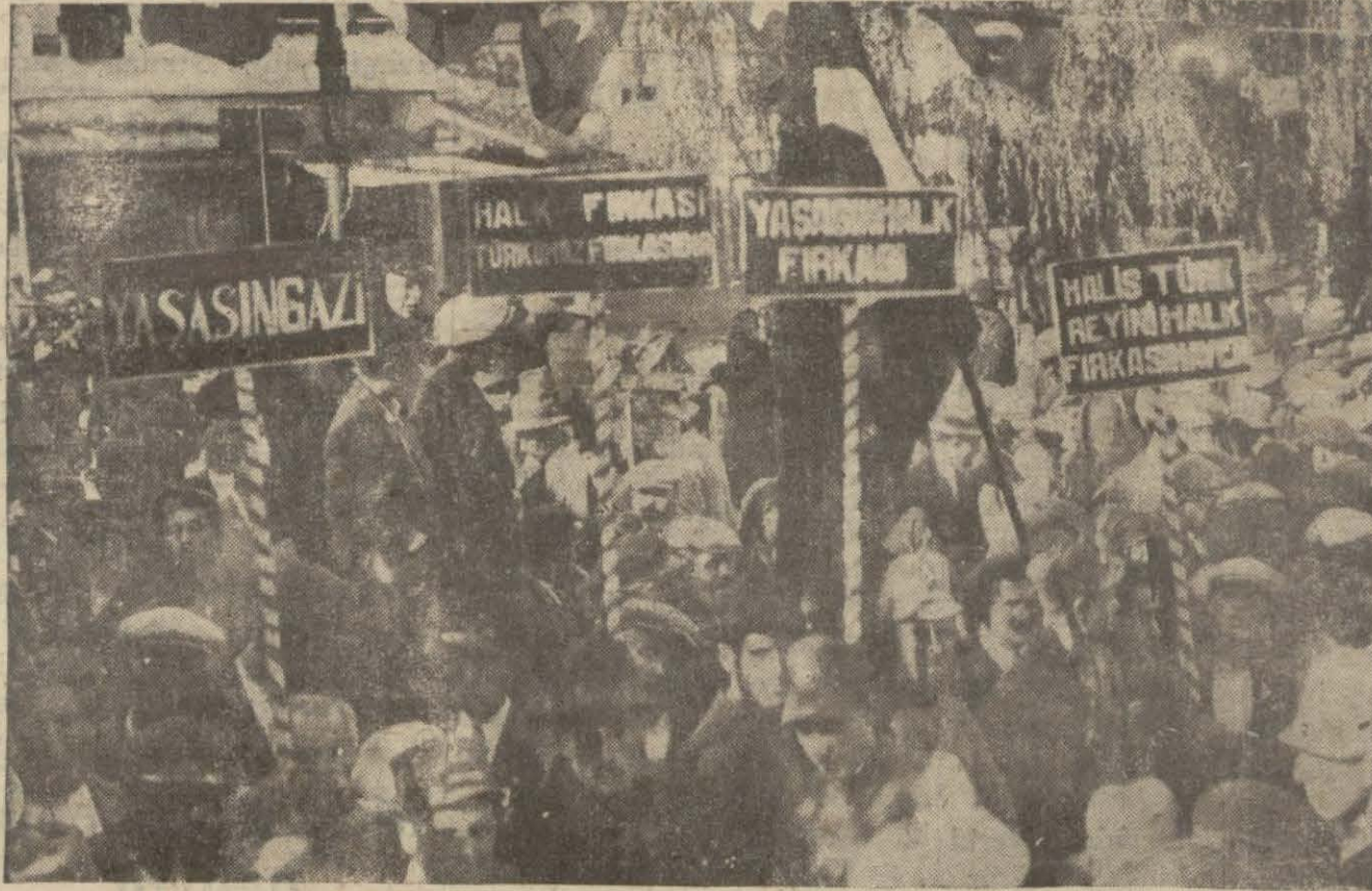
Dün intihap yerlerinde Halk fırkası lehinde yapılan tezahürat