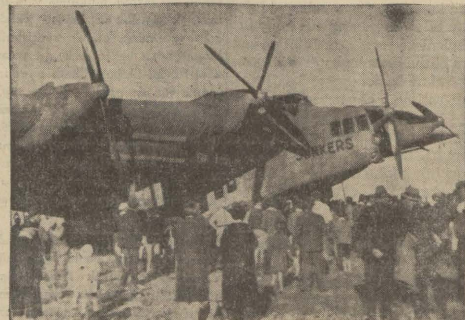
Dün Yeşilköye inen dört motörlü Yunkers tayyaresi

Tayyare İstanbul üstünde uçtuktan sonra Yeşilköye indi