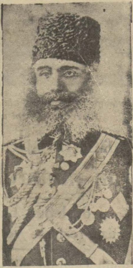
Kabasakal Çerkes Mehmed Paşa

Vahideddin Efendi Yıldız sık sık gelir, bazan akşam taamından sonra Hünkârı görürdü. Sultan Hamit ekseriya Vahideddin Efendiyi tiyatroya da vet eder, kendisiyle orada uzun uzadıya görüşürdü. Vahideddin Efendinin Sultan Hamide muttasıl havadis taşıyıp getirdiği mevzular rivayet olunurdu ki bunun jurnalcılıktan bir farkı yoktu. Hanedan azasının ahvalini, saraylarda olup biten şeyleri Vahideddin Efendinin Abdülhamide jurnal ettiği söylenip dururdu. Sultan Hamit, Reşat Efendinin bir münasebetle bahis sırasında "bilmem ki Reşat Efendiden ne beklerler?", demişti. Kezalik diğer bir münasebette Vahideddin Efendinin Reşat Efendinin daha muhtedir ve dirayeti olduğunu söylemişti. Sultan Hamidin bir taraftan Reşat Efendiyi çürütmeğe ve diğer taraftan Vahideddin Efendiyi ondan yüksek göstermeğe matuf olan bu sözleri, olsa olsa, enzarı dikkati Reşat Efendiye initaftan çevir-