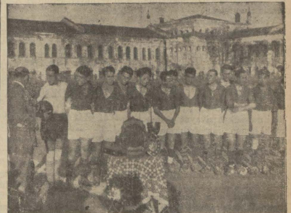
Dün İstanbul muhtelitini yenen Fenerbahçe takımı

Galatasaray yaşlıları tekaütler muhtelitini 3-1 mağlûp ettiler