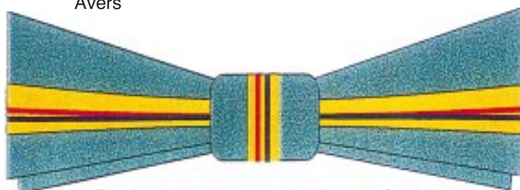
Funda pentru persoanele de sex feminin