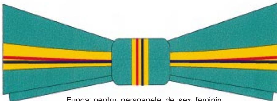
Funda pentru persoanele de sex feminin