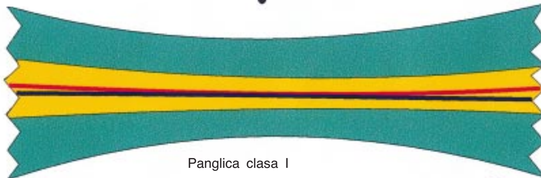
Panglica clasa I