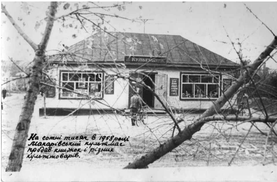
На сотні тисяч в 1958 році Макарівський культшале пробав книжок і різних культтоварів.