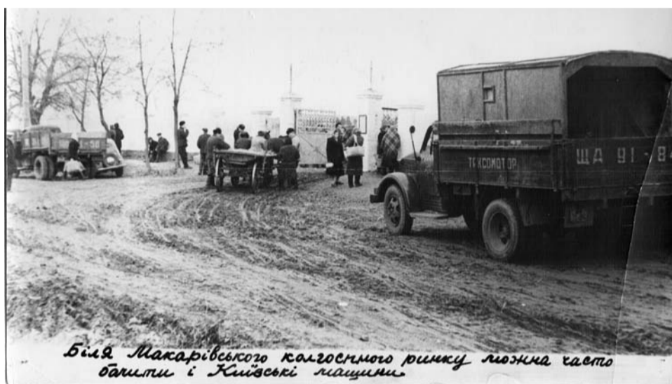
Біля Макарівського колгоспного ринку можна часто бачити і Київські машини