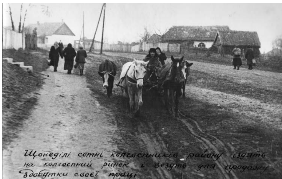
Щонеділі сотні колгоспників району їдуть на колгоспний ринок і везуть для продажу здобутки своєї праці