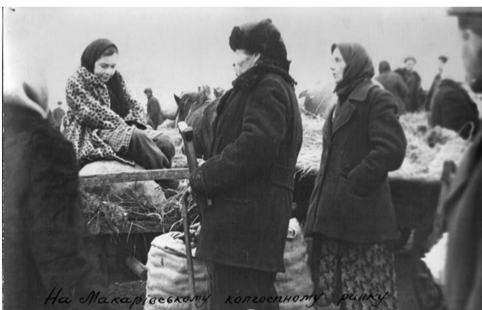
На Макарівському колгоспному ринку