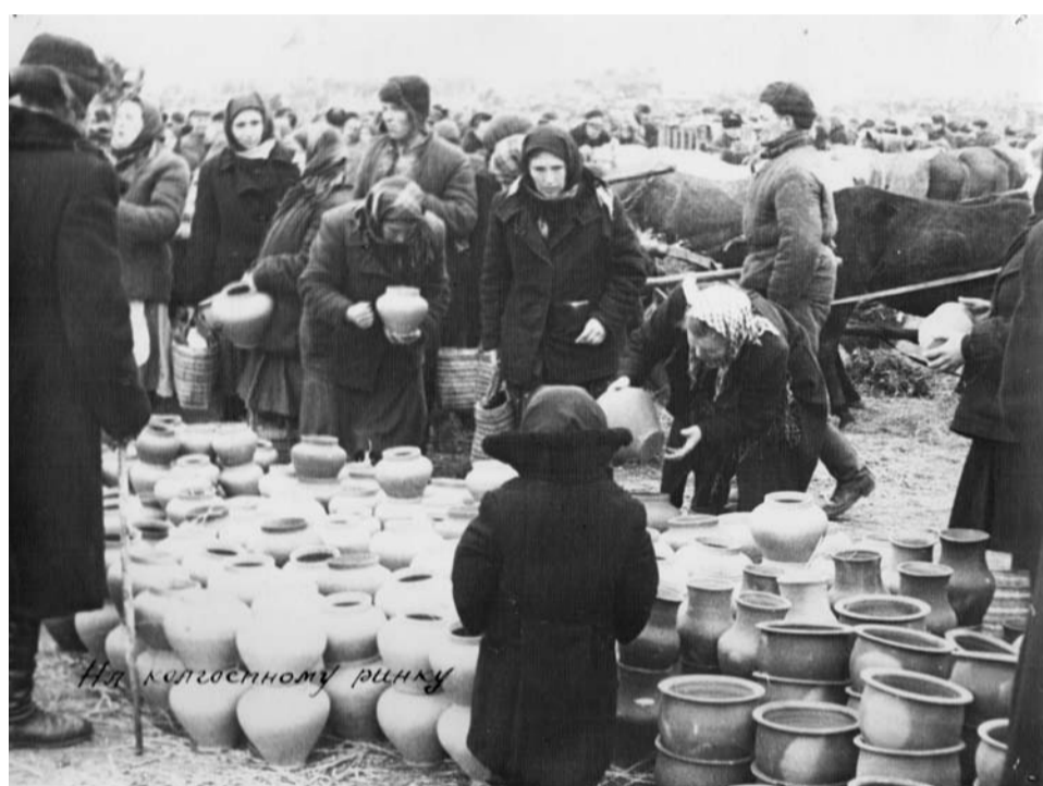
На колгоспному ринку