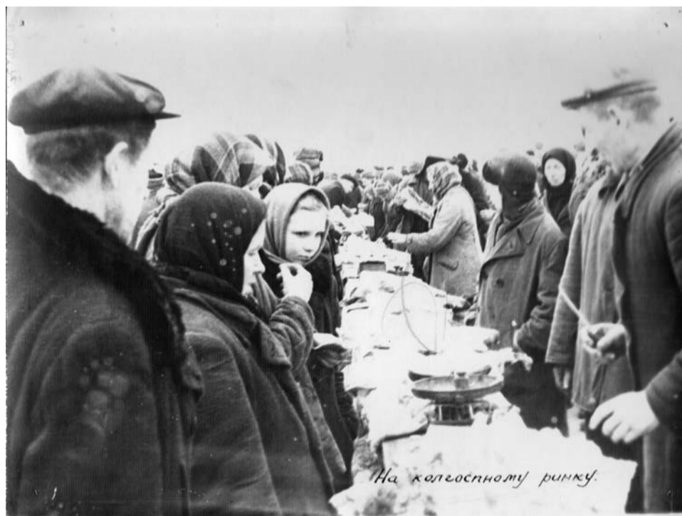
На колгоспному ринку.