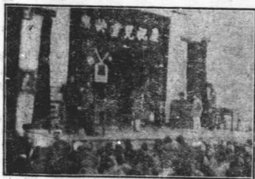
歌 舞 表 演 之 一

體表演和國術舞蹈比賽的會場，九點多鐘就來了兩批，沒用兩個鐘頭，陸續着八百座都佔滿了，忙了