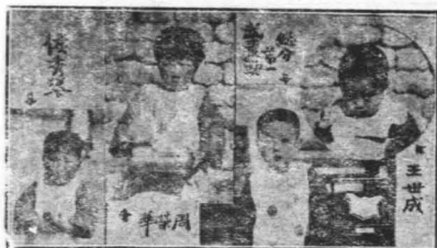
嬰兒比賽第一名(四人)