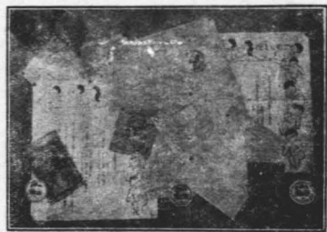
本館宣傳 品及表格 入場券報 名證之一 斑

現在社會上的主人翁，而是從前的兒童。換句話說：將來社會上的主人翁，就是現在的我們這般小朋友。我們要知道，這些主人翁，是換着全世界文化進退和民族興亡的大樞，所以我希望小朋友要努力自強，不要辜負了諸位先生們，父兄們這番盛意