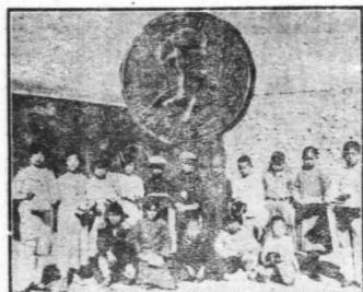
得獎兒童合影 (上方係本館獎牌)