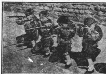
通縣女師附小表演 小小義勇軍