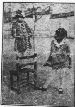
通縣女師附小表演「小鴛哥」